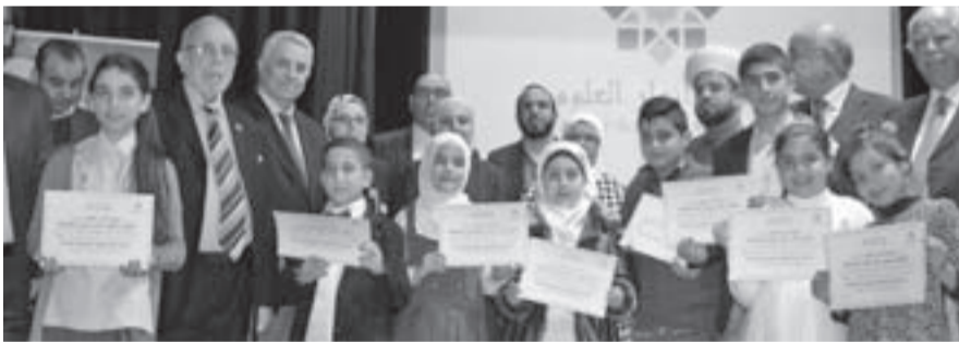
الفائزون بالمسابقة محاطون بأعضاء الجمعية، وضيوف الشرف

النشاطات في زرع هذه الرسالة في نفوس الطلاب. ثم كانت كلمة مفتي الجمهورية اللبنانية، ألقاها الشيخ محمود الخطيب، أثنى فيها على صاحب الذكرى النبي محمد صلى الله عليه وسلم، وعلى دور الرسالة النبوية في إحياء القلوب وزرع المحبة والسلام لدى الجميع، وأثنى على دور جمعية أنوار العلوم البارز وعلى المسابقة الهادفة.