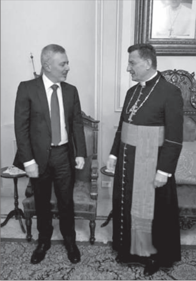
الكاردينال بشاره الراعي مستقبلاً النائب سليمان فرنجية في بركي

التصريح الذي أدلى بها النائب سليمان فرنجية بعد انتخاب الرئيس عون مباشرة، أظهر أن الرجل زاهد بأي منصب وزاري، وهذا ليس بمستغرب عنه، لأنه يعتبر أن موقعه السياسي هو مادامت خسارته المقعد النيابي عام 2005 جعلت منه أكثر زعامة، مع تعاطف شعبي تعدي منطقة الشمال، وفحوى هذا التصريح أن مشاركته في أية حكومة تتوقف على الوزارة التي قد تعرض عليه، وهو الذي أجساد الانسحاب الهادئ من السباق الرئاسي، وطلب من الرئيس بري وسائر الراغبين بانتخابه، الاقتراع بورقة بيضاء، لكن إذا كان النائب فرنجية يعلن أنه لا يرغب المشاركة بالحكومة إذا لم تكن الوزارة المعروضة وازنة، فإن هذه المشاركة يصير عليها الرئيس الحريري، الذي أطلق على حكومته العتيدة مسمى «حكومة الوحدة الوطنية»، ولن يقبل بحكومة يكون «تيار المردة» خارجها، والرئيس بري الذي أخذ على عاتقه التفاوض بشأن وزارات حزب الله، والنائب فرنجية لن يفرض بحقوق أي من الفريقين، إضافة إلى أن الرئيس ميشال عون لن يوقع مرسوم تشكيل حكومة يغيب عنها وزير لـ «المردة».