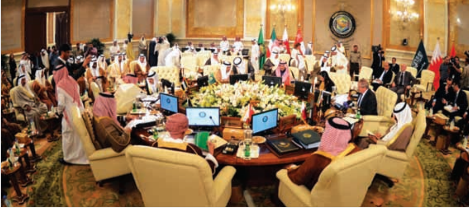
بريطانيا للسعودية: أنت في أفضل الحالات شقيقة كبرى لدول الخليج ولن تكوني الأم أو الأب.. وابقى في الصف بانتظار تعليماتنا

بعد مئة عام تعود بريطانيا لتفقد أبنائها من الملوك والإمارات والمشيوخ الذين اصطنعت لهم دولاً تكاد الواحدة منها لا تساوي أحد أحياء القاهرة المزدهمة، والتي لا تمتلك أي مقومات القوة غير موارد النفط والغاز التي تعمل فيها بصفة ناظر بالوكالة لصالح أميركا والغرب.