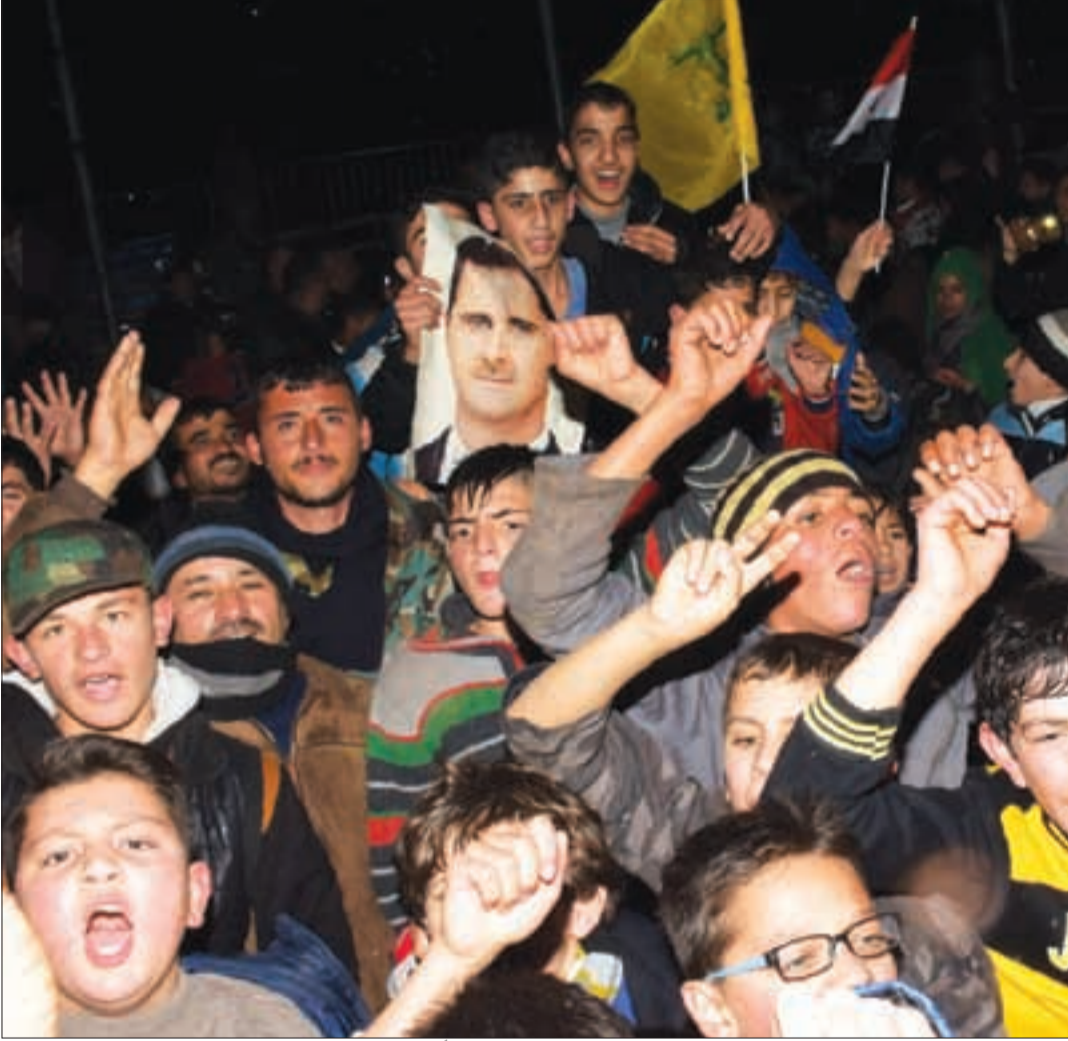
مواطنون سوريون خرجوا إلى شوارع حلب فرحاً ببدء اندحار الإرهابيين عنها