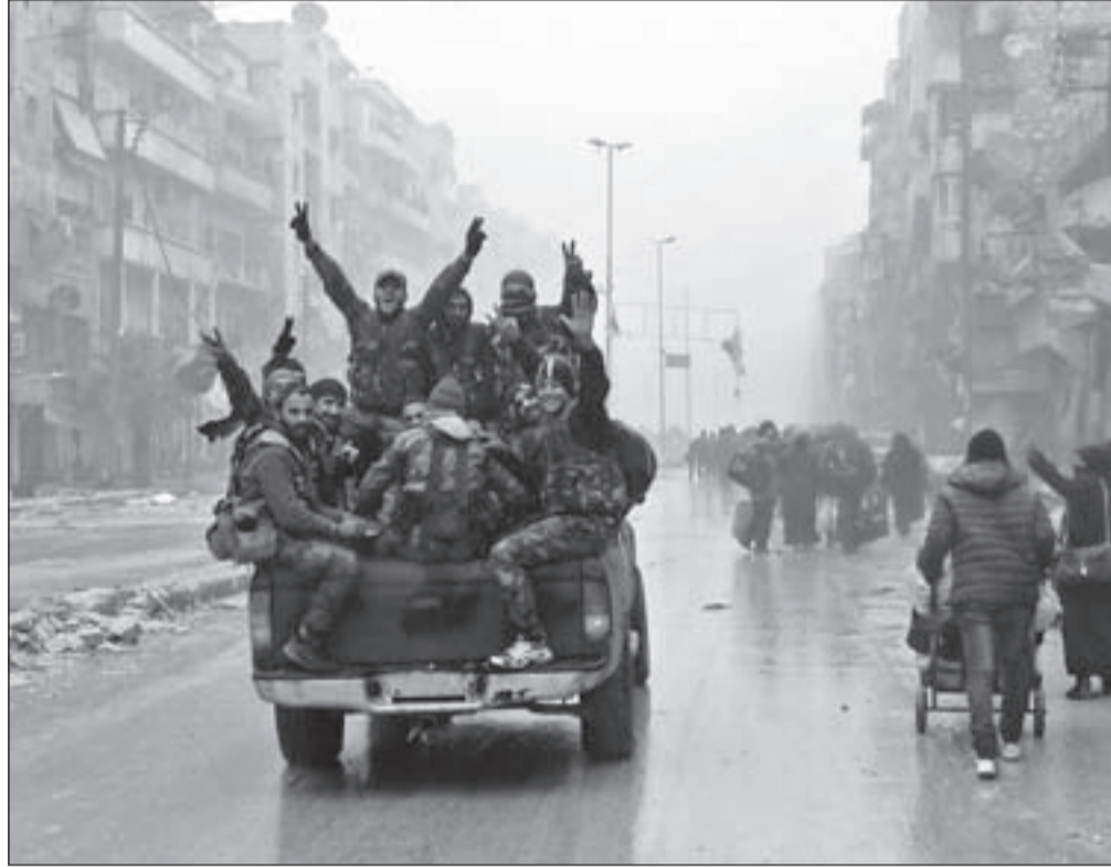
عناصر من الجيش السوري يدخلون أحياء حلب وسط ارتياح أهالي المدينة

دوراً استثنائياً في تحرير المدينة منذ شهر خلت، فلم يتخل فيه بإنزال قوات خاصة روسية على الأرض للمشاركة في عملية تحريرها. موقع «غلوبال ريسرتش» الكندي، الذي لفت إلى أن إدارة أوباما والغرب الموالي له، كما السعودية وتركيا وقطر، أصيبوا بحالة زعر حقيقية مع انهيار الإرهابيين في حلب، كشف عن اجتماعات أمنية ضمت ضباطاً في الاستخبارات التركية والأميركية في منطقة قرقيش التركية الحدودية، قبل أسبوعين من «غزوة» تدمر، حيث بدأ التنسيق والإعداد لحشد أعداد ضخمة من مقاتلي «داعش»، يتم سحبهم من الرقة ودير الزور باتجاه الوسط السوري، لتعطى إشارة انطلاق الهجوم، وسط ضباب كثيف اضطر المقاتلات الروسية بادئ الأمر إلى الانكفاء عن سماء المدينة، قبل أن تعاود ضرب المهاجمين باستخدام صواريخ كاليبر وتجبرهم على التراجع، إلا أن التنظيم استطاع لملمة صفوف مقاتليه والنجاح بهجومهم الثاني. ولكن!