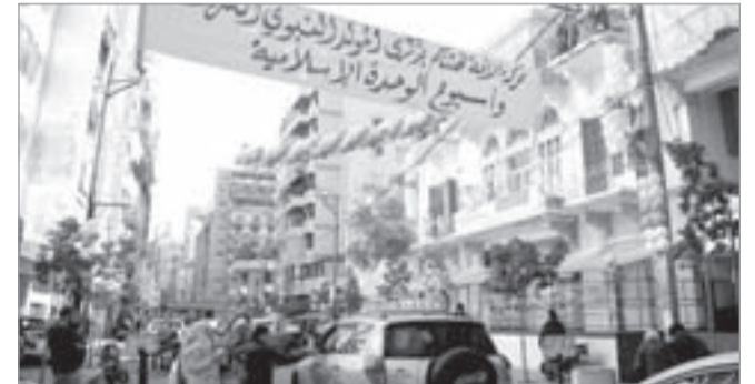
براعم حركة الأمة يوزعون الحلوى بمناسبة المولد النبوي الشريف

هنأت حركة الأمة في بيان لها، الأمة الإسلامية والعربية، بذكرى المولد النبوي الشريف وأسبوع الوحدة الإسلامية، سائلة الله سبحانه وتعالى أن يعيد هذه المناسبة على شعوب أمتنا بالخير والأمان والنصر، وأن تكون هذه الذكرى مناسبة للوحدة والتآلف والتضامن، ونبذ الفتن والشقاق، ومدعاة لوحدة الصف والكلمة بين المسلمين. وللمناسبة المباركة أقامت اللجنة الشبابية الطلابية وبراعم «الحركة» حواجز محبة في عدد من شوارع العاصمة بيروت، حيث رفَعوا الياقات ووزَعوا الحلوى والهدايا على السيارات والمارة، وسط الأناشيد والمدائح النبوية الشريفة.