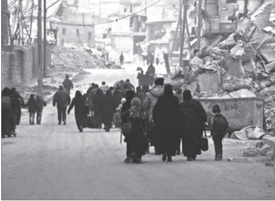
سكان شرقي حلب يعودون إلى منازلهم للبدء بعملية إعادة الإعمار

الروسي بالحسم الذي حصل هذه المرة سريعاً. فثلاثة أسابيع فقط كانت كافية لتنتهي وجود الإرهابيين في الشهباء، مما يمثل نقلة نوعية وأساسية في مسار الحرب على الدولة السورية وأهلها من جهة، وليعيد التوازن الاقتصادي إلى عجلة الدولة، مع تحرير أهم مدينة اقتصادية في الشرق الأوسط من براثن الإرهاب من جهة ثانية، خصوصاً أن حلب تعتبر ذات ثقل اقتصادي لسورية، بالإضافة إلى أهميتها السياسية كورقة تفوق ميداني كبير في المفاوضات السياسية الدولية، وربما هذا ما يفسر محاولات الأميركيين التي كانت تجري لبقاء الشهباء تحت رحمة التهديد الإرهابي، بالإضافة إلى محاولات السلجوقي رجب طيب أردوغان إدخال قوات تركية ودعم المجموعات الإرهابية بمختلف الوسائل.