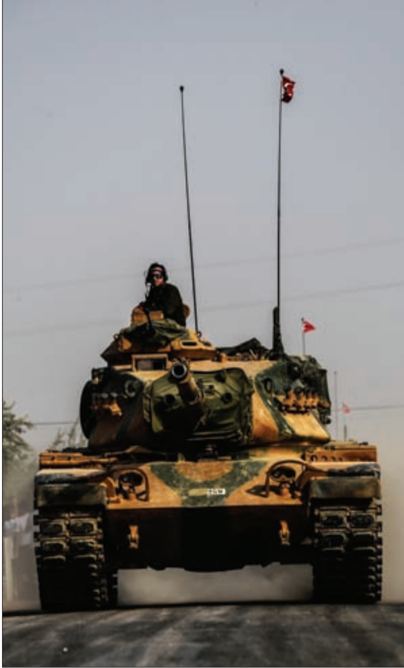
هل يسمح الأميركي للتركي بتجاوز الخطوط الحمراء مع الأكراد؟

وتعمل للتوغل بعمق 50 كلم، ولعودة الأكراد إلى شرق الفرات، وعزلهم عن غربه.