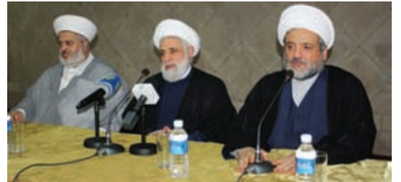
الشيخ نعيم قاسم متحدثاً