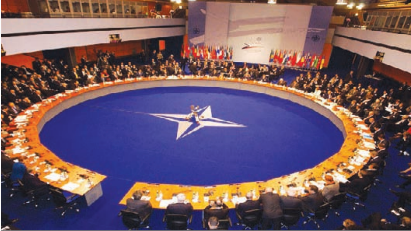
روسيا: ممارسات الأطلسي تهدد الأمن الأوروبي.. والاتفاقات المبرمة بين روسيا والناتو

ودول حلف وارسو السابق، وبعد بضعة أشهر سيتم نشره في كل من بولندا وليتوانيا ولاتفيا واستونيا، وبدأت مبالغة الإعلام بالقدرات الروسية لتأليب الرأي العام، حيث نشرت صحيفة «صن» البريطانية أن «روسيا قادرة بخمس أو ست قنابل نوع ساتانا-2 على إزالة السواحل الشرقية للولايات المتحدة من على وجه الأرض خلال دقائق»، وكذلك طلبت سامانتا باور: مندوبة أميركا لدى الأمم المتحدة، من مجلس الأمن الدولي فرض حصار اقتصادي كامل على روسيا، بسبب «تدخلها بالحقل الكهرومغناطيسي للأرض»، واعتبر ريتشارد شيريف: النائب السابق لقائد قوات الناتو في أوروبا، أن الحرب بين الأطلسي وروسيا قادمة لا محالة، مرجحاً اندلاعها قبل نهاية العام الجاري، وفي المقابل اعتبر ألكسندر غروشكو: مندوب روسيا لدى حلف الناتو، أن «ممارسات الأطلسي صارت تولد خطراً يهدد الأمن الأوروبي بالكامل، والاتفاقات المبرمة بين روسيا والناتو».