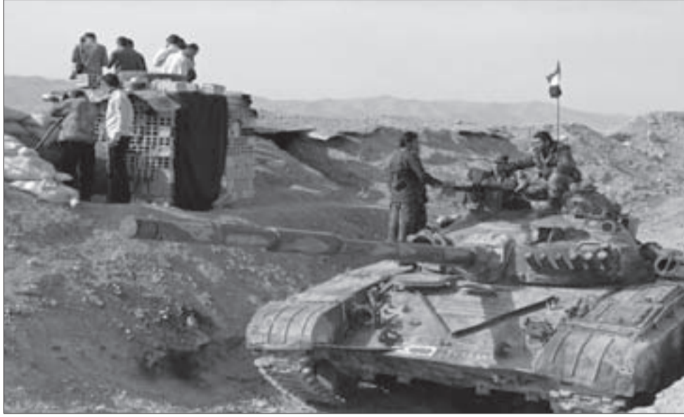
عناصر من الجيش السوري عند أحد مرتفعات ريف اللاذقية

ما بقي من معارضة إعلامية، وها هو الآن يحاول أن يغلق صحيفة «جمهوريات»، وهي أقدم الصحف التي صدرت مع إعلان الجمهورية التركية عام 1923، حيث تتعرض للمضايقات الحكومية واعتقال رئيس تحريرها، وعدد من محرريها، وما زال أردوغان يهدد الجريدة ويتوعدّها، في نفس الوقت الذي بدأ يهدد نواب من المعارضة، ويتوعد «حزب الشعوب الديمقراطية»، ويعتقل عدداً من مسؤوليه في المناطق والبلديات التركية... بشكل بات فيه الحديث واسعاً عن حرب أهلية محتملة في العديد من المناطق التركية، مما سيجعل وحدة تركيا على المحك في ظل الإرهاب الأردوغاني المتصاعد، والذي بات يخشى حتى من ظله.