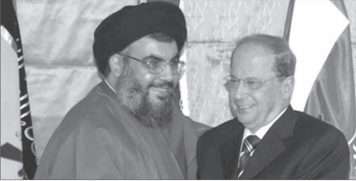
وثيقة «مار مخايل» أسست لحلف مشترك للدفاع عن لبنان

ترسيم خرائط»، في أخطر وأقذر خطط رسم «الإسرائيليات»، وليس من يسأل عن ملايين هجروا، ومئات آلاف ذبحوا، من مسيحيين وإيزيديين ومسلمين شيعة وسنة، في مخطط كشفت عنه وثائق وتقارير، ودلت عليه وتؤكد كل يوم ممارسات التكفيريين الإرهابين، ومن وراءهم من داعمين وممولين، وليس من قبيل الصدفة أنهم أنفسهم من يرعون الإرهاب وتمزيق الأوطان، كانوا ضمن مطبخ إعداد رئيس لبناني، وعانى منهم حزب الله وميشال عون أشنع تجارب التأمير التي يندي لها جبين الإنسانية، بدءاً من النشاط المخابراتي والعمل الإرهابي على لبنان، إلى محاولات شق الصفوف وضرب التحالفات، ووصولاً إلى المال الانتخابي الوسخ الذي ظهر حتى في انتخابات بلدية لمحاربة ميشال عون، وتدقق كما «الشغور» خلال الأسبوع الماضي، لضمان عدم وصول عون، حتى ولو لم يصل الخصم، فليكن رئيس وسطي ولا يصل حليف حزب الله و«ابن رعية مار مخايل»، إلى حدود إثارة الفوضى، عبر لعبة الظرف الزائد التي أخذها سامي الجميل ذريعة لتكرار الاقتراع، ليست سوى آخر محاولات لعب الكباش مع الكبار.