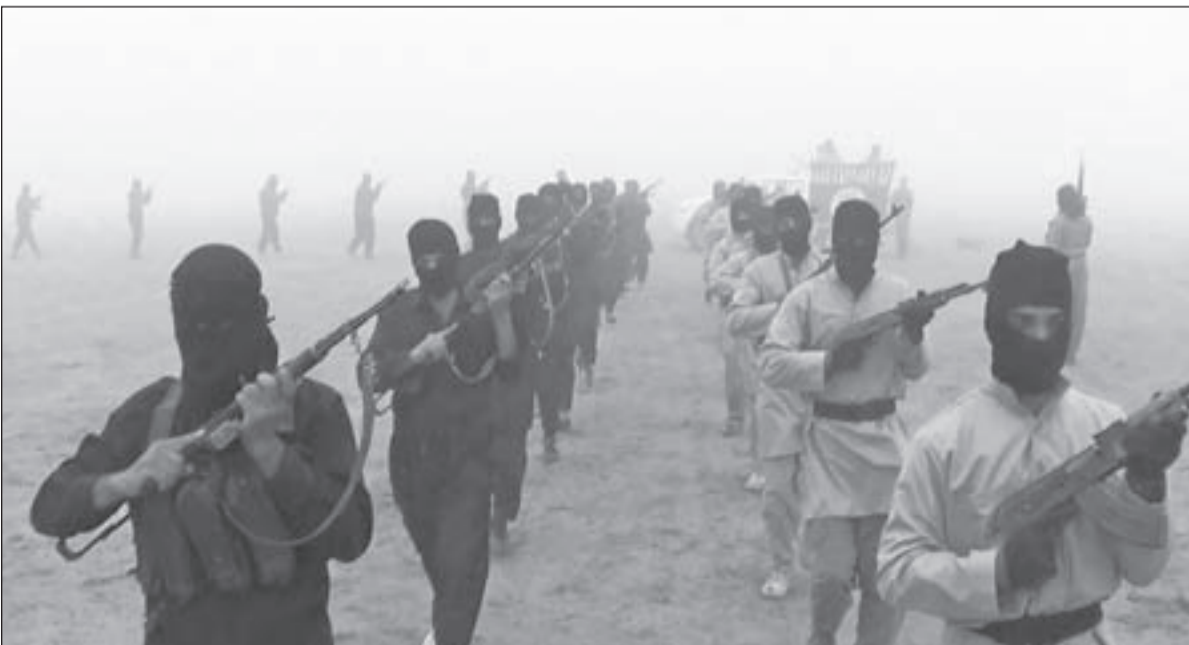
مسلحو «داعش» يتدربون في جرد عرسال

وإذا كان القبض على «النسوة» جاء على خلفية ضبطهن بالجرائم المشهود كإرهابيات وليس كزوجات،