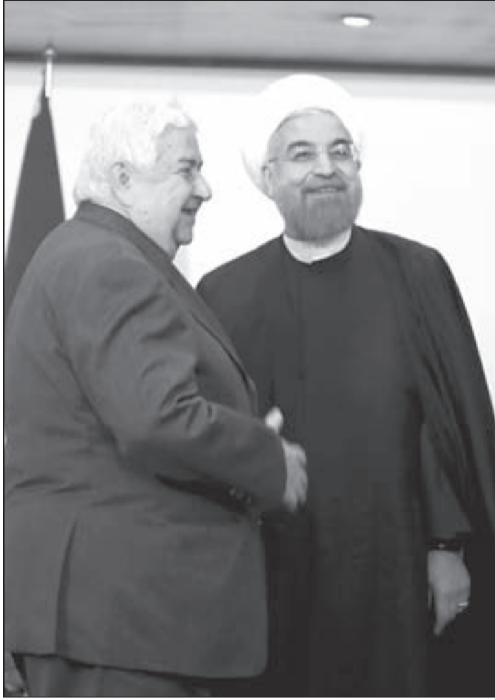
الرئيس الإيراني الشيخ حسن روحاني مستقبلاً في طهران وزير الخارجية السوري وليد المعلم

في أكثر من مكان؛ من بساب المنذب، إلى سورية ولبنان والعراق، وبينها الشعب الفلسطيني الباسل، إلى أكثر من مكان في العالم. ثمة إرهابيات متسارعة تؤشر إلى أن العالم يستعد لوضع أسس نظام عالمي جديد، كان قد أعلن عنه فلاديمير بوتين مع بداية الأزمة السورية حينما قال: «إن قواعد النظام العالمي الجديد تخرج من سورية»، ما يعني أن هذا النظام سيحكم العالم في السنوات المقبلة، بعد أن فقد الأميركي قوته التي تضع السياسات