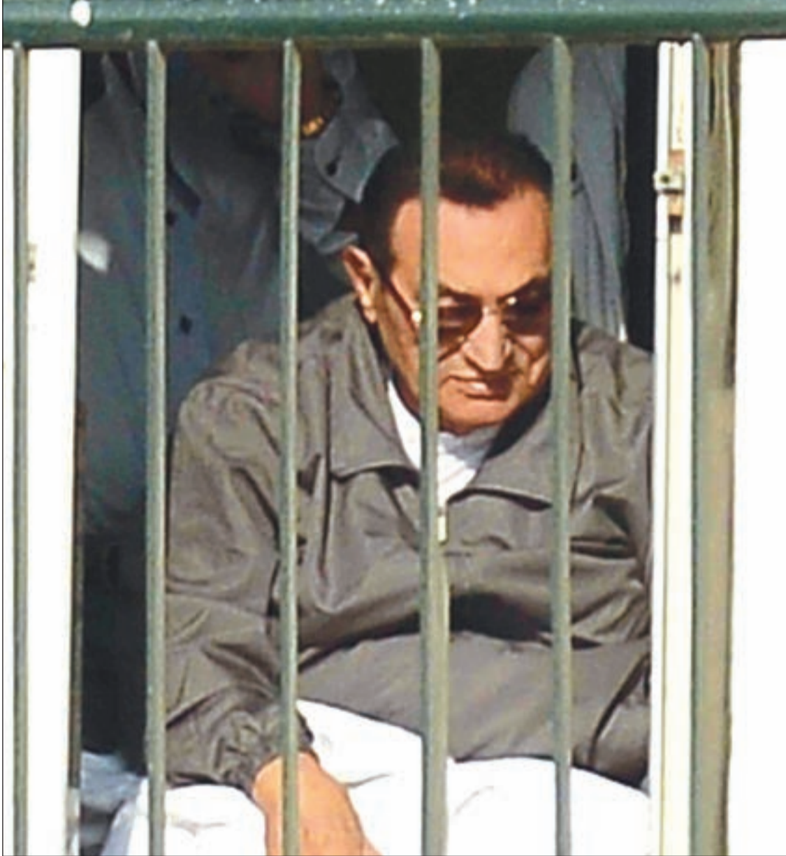
تبرئة مبارك تمنح «الإخوان المسلمين» ورقة قوية في سعيها لتأليب الرأي العام ضد حكم السيسي

يحكمون مصر من داخل حبسهم في سجن طرة، كما أن ذلك يمكن أن يؤدي إلى حالة إحباط لدى الشباب الذي كان عماد الثورتين، والاستنكاف عن المساهمة في النهضة المطلوبة لبلد يقاسي الكثير. ليس من قبيل التهكم أن يلجأ الرئيس السيسي إلى الدعوة والتأكيد على «الثقة الكاملة بعدالة قضاة مصر ونزاهتهم وحياديتهم وكفاءتهم المهنية»، بل إقران البيان الذي تضمن ذلك بتوجيه لرئيس مجلس الوزراء بـ«اتخاذ الإجراءات اللازمة لمراجعة الموقف بالنسبة لتعويضات ورعاية أسر شهداء ومصابي الثورة الذين قدموا حياتهم من أجل رفعة الوطن»، وهو ما اعتبره أعمدة محركي الثورة رشوة سخيفة. لقد شدد البيان الرئاسي على تأكيد السيسي أن «مصر الجديدة ماضية في طريقها نحو تأسيس دولة ديمقراطية حديثة قائمة على العدل والمساواة