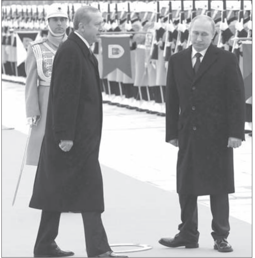
هل يقتنع أردوغان أن بيئته الحاضنة هي الشرق والبحور الأربعة وليس الاتحاد الأوروبي وأميركا أو «إسرائيل»؟

تتميز العلاقات الروسية - التركية تاريخياً بالتوتر والحروب، حيث نشبت خلال الخمسة قرون الماضية عشرة حروب بين الإمبراطورية العثمانية والروسية في عهد القيصرية، ورجحت السيطرة على جزيرة القرم ميزان القوى بين الإمبراطوريتين، وعندما سيطرت