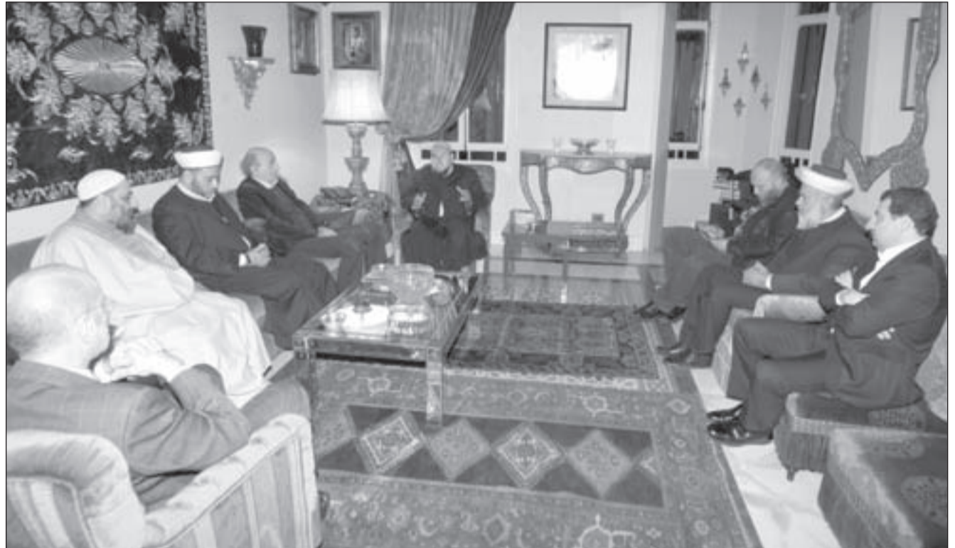
من هي الجهة التي أوعزت لهيئة العلماء، لتعود إلى الواجهة كوسيط مرة جديدة؟

يفضح عما هو أدهى وأخطر، «وكأنه لا يعلم أن الموقوفين الخطيرين في رومية» لهم من التسهيلات (طعام ساخن، وهواتف خليوية، وأجهزة كومبيوتر وانترنت)... ما يحلم بها كثير من اللبنانيين العاجزين عن اقتنائها.