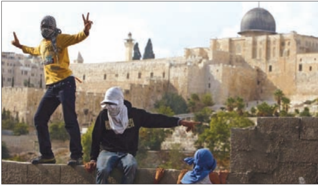
مواجهات في القدس

الحرة، وحق التملك وتأمين الضمانات الصحية والاجتماعية، والإسراع في إعمار مخيم نهر البارد، وتوفير الأموال اللازمة لذلك، وتكثيف الجهود الفلسطينية واللبنانية لمعالجة هذا الملف، لأن ما جرى في مجلس النواب عام 2010 من تعديلات تخدم حق العمل للفلسطينيين يجب ألا يكون فصل الختام، بل خطوة ينبغي أن تتلوها خطوات لإقرار الحقوق الإنسانية كرامة واحدة، ودون تجزأة، لأن ذلك يدعم نضال اللاجئين وحقهم في العودة وفقاً للقرار 194.