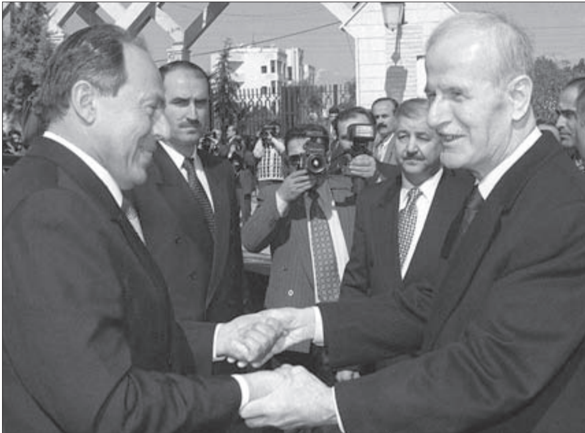
الرئيس اميل لحود والرئيس الراحل حافظ الأسد

يشدد الرئيس إميل لحود على أنه عندما كان يحضر لخطاب القسم، كان يفكر في مصلحة جميع اللبنانيين، «بمن فيهم الرئيس رفيق الحريري، وأنا حتى اليوم ما زلت مقتنعا بأن هذا الخطاب هو الذي يجعل لبنان قادراً على النهوض، لكن مع الأسف الشديد، اكتشفت بعد الممارسة السياسية أن أكثرية السياسيين لا يفكرون في مصلحة لبنان وشعبه، بل بمصالحهم الشخصية، ولذلك كانوا يضعون العصي في الدواليب في وجه أي مشروع، إذا لم تكن فيه إفادة لهم».