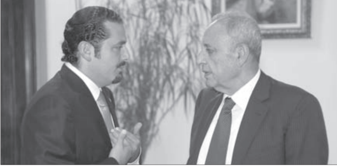
استطلاعات الرأي تؤكد تراجع شعبية الرئيس الحريري في كل المحافظات اللبنانية