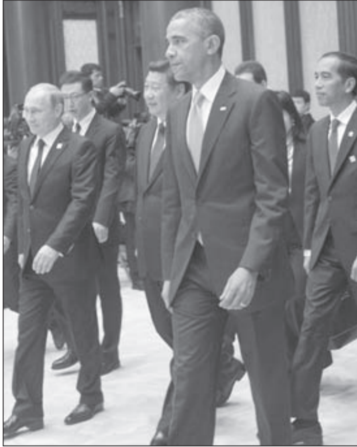
واشنطن تجدد نفسها اليوم مضطرة للبحث عن حلول لأزمات أوكرانيا وسورية والملف النووي (أ.ف.ب.)

«صناديق مال الحكام العرب يمكن أن تشتري حتى الخيال»، قالها يوماً إدوارد سعيد، لكن إلى أين يذهب مال الخيال هذا، والذي لا يجني الأعراب منه إلا ثلثه فقط؟ ذلك لأن هذا المال تقسمه واشنطن والغرب لهم على ثلاثة أثلاث: