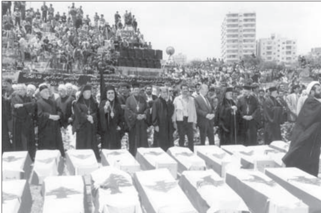
رجال دين وشخصيات أمام أضرحة شهداء قانا

طائفي فاقح، فالمعروف أن الألوية ذات الطابع المسيحي الغالب هي الخامس والسابع والثامن والتاسع والعاشر، وكذلك مغاوير الجيش وأفواج المدفعية الثقيلة، والألوية ذات الطابع الإسلامي العام إثنان، الأول والثاني عشر، واللواء ذو الطابع السنّي هو الثاني، واللواء ذو الطابع الشيعي هو السادس، واللواء ذو الطابع الدرزي الغالب هو الحادي عشر، واللواء ذو الطابع المختلط في حقيقة الأمر هو الثالث، أما هوية قائد كل لواء وهوية منطقة انتشاره فيتطابقان وهوية غالبية العناصر في كل لواء، اللهم إلا اللواء الثالث ذا الطابع المختلط الذي توزعت كتابته على أكثر من منطقة.. هكذا كانت المذهبية والطائفية تطغيان على بنية الجيش عندما تسلم العماد إميل لحود قيادته، وقد ساهم هذا التوزع المذهبي والطائفي لألوية الجيش في إقحام الجيش في الحرب الداخلية، وبالتالي في تاجيح هذه الحرب وتصعيدها، وزجّ الأسلحة الثقيلة التي يملكها الجيش فيها، ما ضاعف القوة التدميرية لتلك الحرب، وجعل الجيش عرضة للانقسام كلما كلف بمهمة أمنية، وجعل بعض ألوية الجيش أشبه بالمليشيات الفئوية في توجهاتها وسلوكها، وقد بلغ فرز الجيش طائفيًا ذروته في