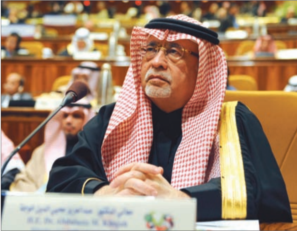
وزير الثقافة والإعلام السعودي السابق عبد العزيز خوجه

والحرية، فوقعوا ضحايا الجهاد الوهمي الخادع، فقتلوا بوحشية وبلا ثمن ملموس، وتحولوا إلى أرقام مجهولة في الصحاري والبراري.