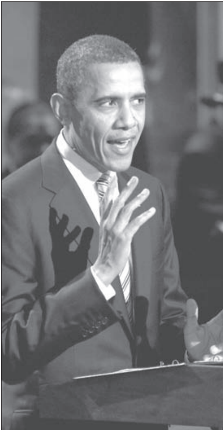
تبدت آمال أوباما في أن يكون إبراهيم لنكون القرن الـ21

نتيجة الانتخابات النصفية للكونغرس مكنت «الجمهوريين» من تشديد قبضتهم على مجلس الشيوخ، وهم أصلاً أكثرية مشهودة في مجلس النواب، ما يعني أن «الجمهوريين» وبالقانون، يمكن أن يعرقلوا أي مشروع لأوباما؛ لمزيد من الإحراج والشماتة، ومن باب النكد إذا أرادوا، كي يظهر أن الرئيس مصنع من الفشل، مع معرفتهم المسبقة بأن «الفيثو» الممسك به رئيس الولايات المتحدة يعطيه حقوق، ومن الصعب عليه استخدامها، إلا إذا أراد «الكباش».. وهو لا يمتلك هذه الشخصية، بدليل أن تعليقه الأول على الهزيمة كان بقوله إنه حريص على التعاون مع الكونغرس الجديد خلال العامين المتبقين من ولايته الثانية، وأنه «يبدد يده للعمل مع الزعماء الجمهوريين، لكن هذا لا يعني أننا لن نختلف حول بعض القضايا»، سيما في القضايا الداخلية، مثل قانون الرعاية الصحية، وإصلاح قوانين الهجرة.