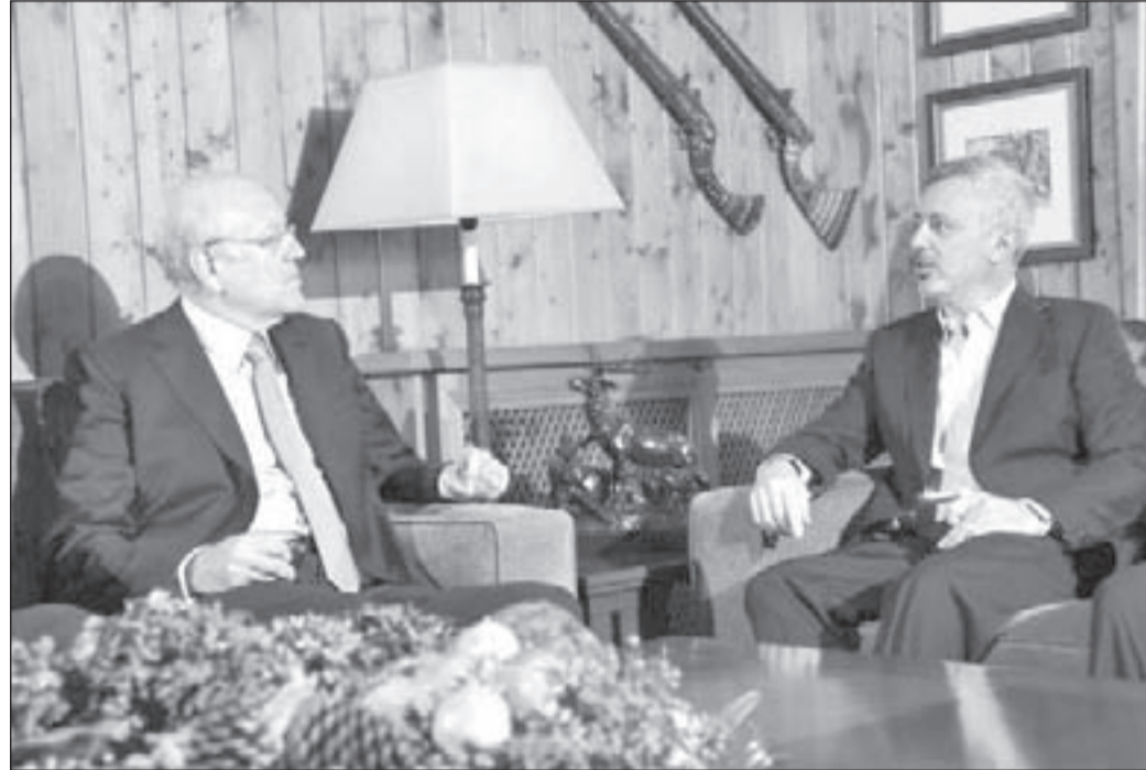
الرئيس نجيب ميقاتي زائراً للنائب سليمان فرنجية في بنشعي

بعد نجاح الجيش اللبناني في إسقاط «مشروع الدولة التكفيرية» في منطقة الشمال، وإعادة الهدوء إلى ربوعها، وملاحقة فلول المجموعات المسلحة وتوقيف غالبية عناصرها، يكون بذلك قد أنهى حلم «الإمارة»، وشل قدرة الإرهابين على التحرك والانتشار مجدداً في هذه المنطقة، حسب ما يرجح مرجع إسلامي واسع الاطلاع.