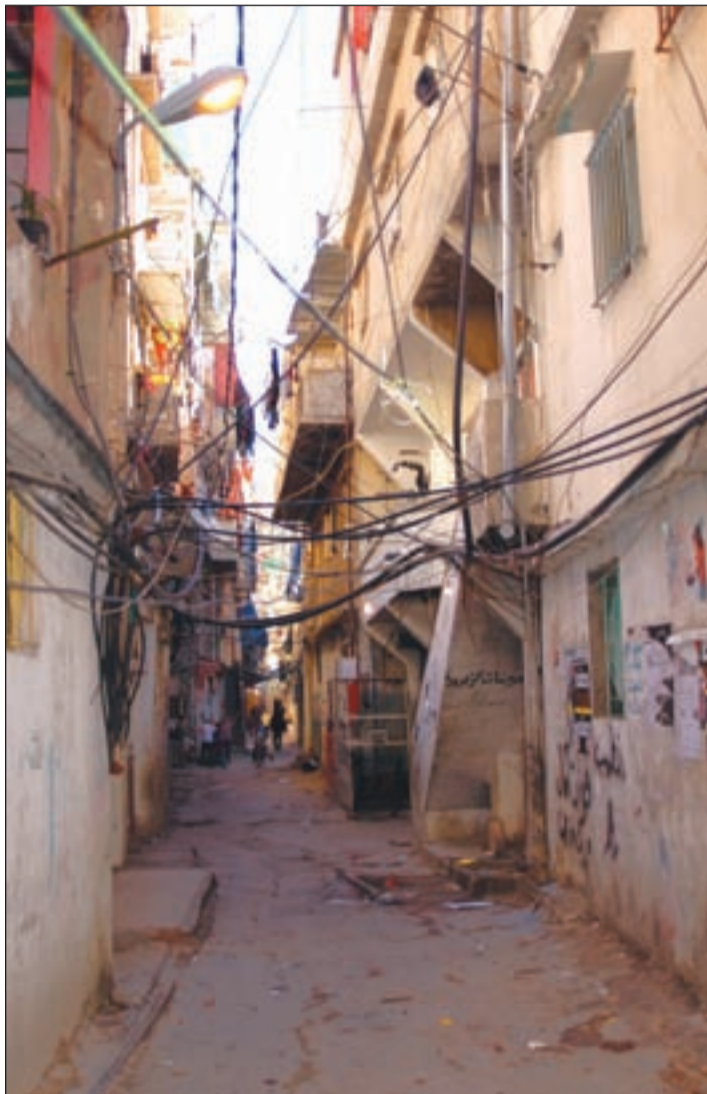
تمديد مجلس النواب لنفسه استمراراً لأزمات الفلسطينيين في لبنان

خلال تجنب المخيمات كل التداعيات السلبية للأحداث الأمنية الأخيرة، إلا أن استمرار الوضع الراهن على حاله لجهة اشتداد حدة الصراع الدولي والإقليمي من شأنه الانعكاس أكثر على الحالة الفلسطينية،