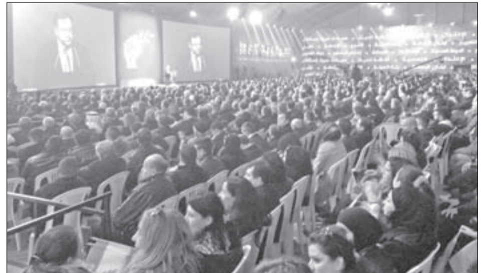
أزمة ثقة بين جمهور «14 آذار» وقياداته

لا ريب أن لبنان ما يزال في دائرة التوتير، في ضوء استمرار الكباش الإقليمية وانعكاساته على الأوضاع الداخلية، لاسيما السياسية منها والأمنية، فالشغور الرئاسي قائم، والتفقت الأمني في عرسال على حاله، لكن على الرغم من ذلك برزت بعض المؤشرات التفصيلية في الآونة الأخيرة، توحى بإمكان التوصل إلى تسوية للصراع الدائر في المنطقة، وستنعكس إيجاباً على الأوضاع الراهنة، وقد تحرك