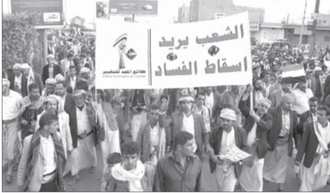
مظاهرات شعبية تجوب العاصمة اليمنية صنعاء مطالبة بمحاربة الفساد

بات مشرعاً، خصوصاً أن «الحوثيين» رفضوا إغراء مشاركتهم في الحكومة مقابل التخلي عن مطلبهم إلغاء قرار رفع الدعم عن المشتقات النفطية، وهو القرار الذي صدر أصلاً بناء على تحذير من البنك الدولي والدول المانحة، بذريعة أن بقاء الدعم سيؤدي إلى انهيار اقتصادي.