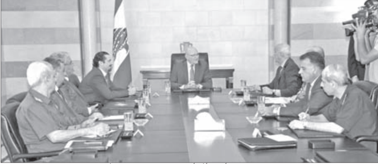
الرئيس تمام سلام مترسماً اجتماعاً أمنياً بحضور الرئيس الحريري والقادة الأمنيين

نزاع بين البعض في الشارع السني والجيش الوطني، فإن هذه «الهيئة» وإن فشلت في محاولاتها التفاوضية لإطلاق العسكريين الأسرى، وأوقفت مساعيها بانتظار قوى إقليمية تكون أكثر قوة في الحضور، وقدرة على دفع «الفدية» المطلوبة، فلا بد من جهة أخرى أن نسال «المستقبل» قيادة ونواباً عن موطىء قدم لهم في الشارع السني بعد اليوم، وسط نشاط هيئة العلماء كبديل عن الممثلين المنتخبين، وردود الفعل السلبية العاتبة على الغيبة الطويلة للحريري في الشارع الحائر: من طريق الجديدة إلى صيدا مروراً بالبقاع الغربي ووصولاً إلى طرابلس وعكار، والإهمال الحاصل في التعاطي مع الجماهير المحسوبة على «المستقبل»، والتي علت صرخاتها في وجهه عبر وسائل الإعلام.