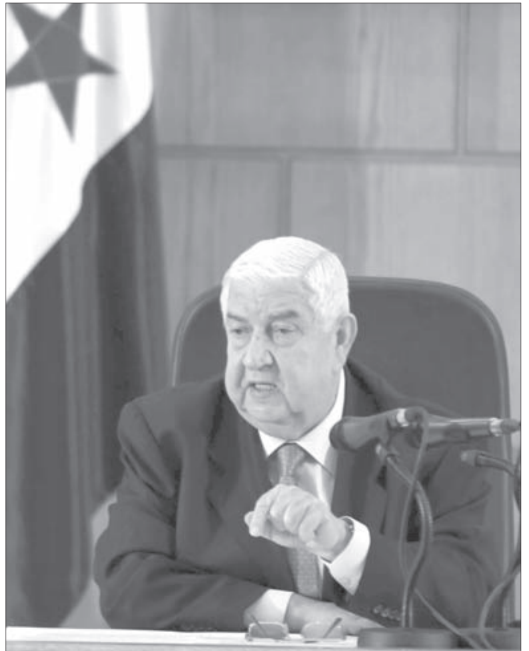
المعلم: أي عمل عسكري ضد التنظيمات الإرهابية في سورية يتطلب تنسيقاً مع الدولة.. وإلا اعتبر عدواناً (أ.ف.ب.)

فعلياً، إن أي متتبع واقعي للأحداث كان يفترض أن المعركة الحاصلة في المنطقة ستؤدي في النهاية إلى تحالف دولي عريض ضد الإرهاب، وإن التمهد لهذا التحالف أو الانخراط فيه سيتضمن - حكماً - التنسيق مع الدولة السورية، لكن في ظل كل هذه التصريحات الغربية المؤيدة للقضاء على تنظيم «داعش»، والضربات الجوية