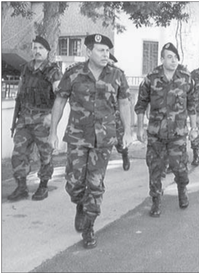
العماد اميل لحود في أحد المواقع العسكرية

حينما صدر مرسوم تعيين إميل لحود قائداً للجيش اللبناني، يؤكد أنه لم يسعَ لذلك، كما أنه لم يسعَ بتاتاً لأن يُنتخب رئيساً للجمهورية، لكنه حين يصل إلى أي منصب أو مكان لا يعمل إلا بوحي ضميره، فيحب عمله ويخلص له، و«أنا في كل حياتي العملية أحببت المنصب الذي أصل إليه، وبالتالي فإنني أعمل أكثر وأعطى أكثر، وحينما بدأت حياتي العسكرية كانت على أساس أن أبقى فيها إلى نهاية خدمتي».