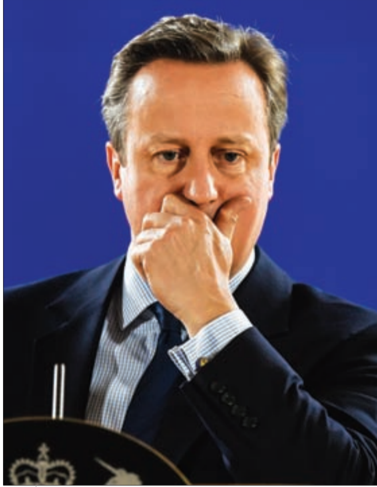
المجتمع البريطاني يعاني من انعدام الثقة بين المواطنين والمسؤولين

الأوروبية وحتى الأميركية، بات يعاني من انعدام الثقة بين المواطنين والمسؤولين، وهو ما تجلى في اعتكاف الشباب عن التصويت بكثافة؛ فقد أشارت الإحصاءات إلى أن فئات الشباب بشكل عام كانت أكثر ميلاً للبقاء من