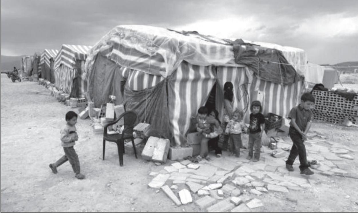
التنسيق مع الحكومة السورية مدخل لمعالجة مشكلة النازحين في «القاع» والبلدات الحدودية

الأكبر» الذي يمكنه أن يلعبه في تنظيم «الإخوان»، في نفس الوقت الذي يرى في «داعش» أنها يمكنها أن تكون الانكشافية الجديدة التي تقود حصانه إلى بغداد ودمشق والقاهرة والمغرب..