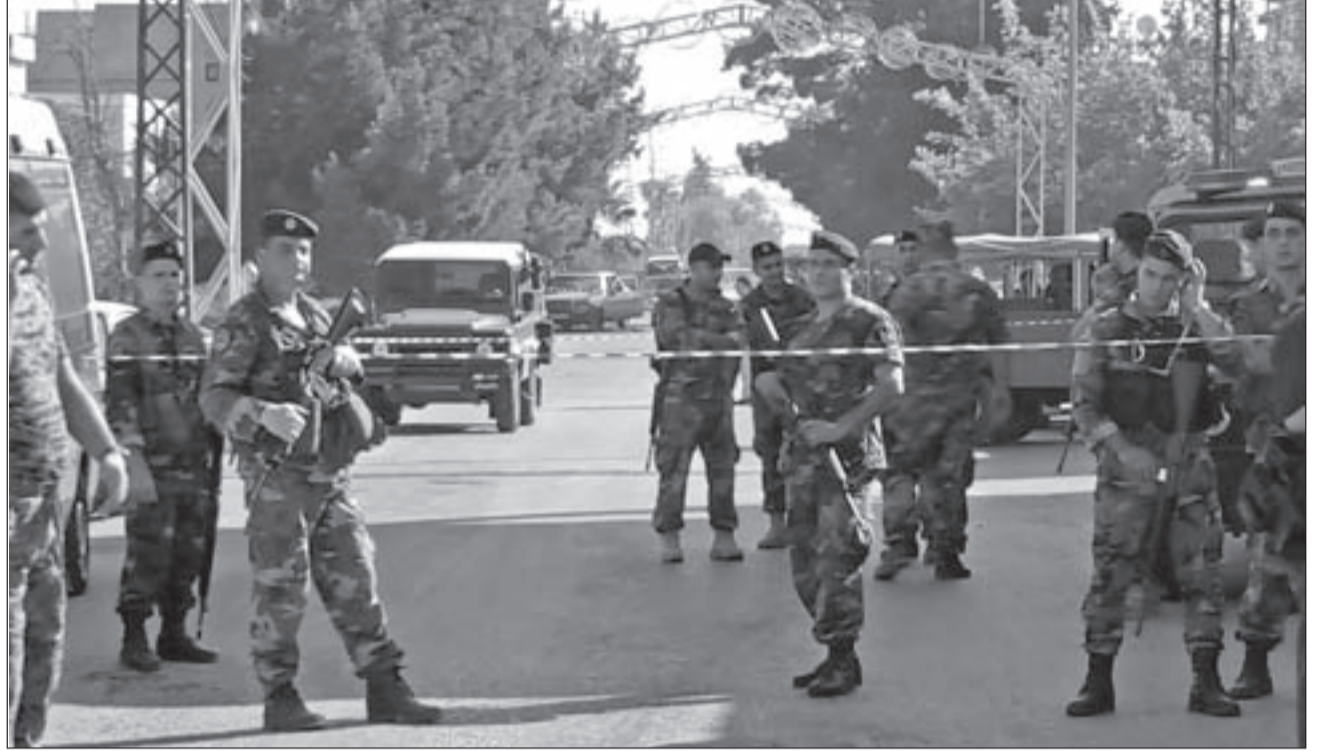
الجيش اللبناني يفرض طوقاً أمنياً حول مكان التفجيرات الإرهابية في بلدة «القاع»

ماذا حلّ بتحقيقات تفجير فردان؟ شددت معلومات مصدرها وزارة الداخلية أن خيوطاً جديدة تمّ التوصل إليها فيما يتعلّق بتفجير فردان، الذي قيل إنه استهدف مصرفاً هناك، وتلك الخيوط بعيدة كلياً عن تلك الاتهامات التي سيقت لتشويه صورة حزب الله، ولذلك يتمّ التريث في الإعلان.