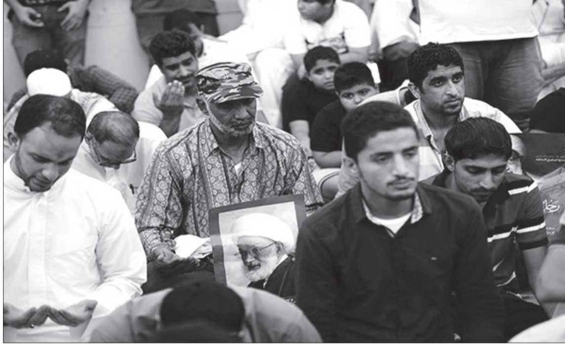
مواطنون بحرينيون يلجئون بالدعاء أمام منزل الشيخ عيسى قاسم في البحرين

تأمين الدعم إلا عبر حرب إقليمية شاملة ودائمة على مستوى الخليج، تشترك فيها إيران والعراق والسعودية، مما يشعل الفتنة المذهبية على المستوى الإسلامي الشامل، وهذا ما تخطط له أميركا و«إسرائيل».