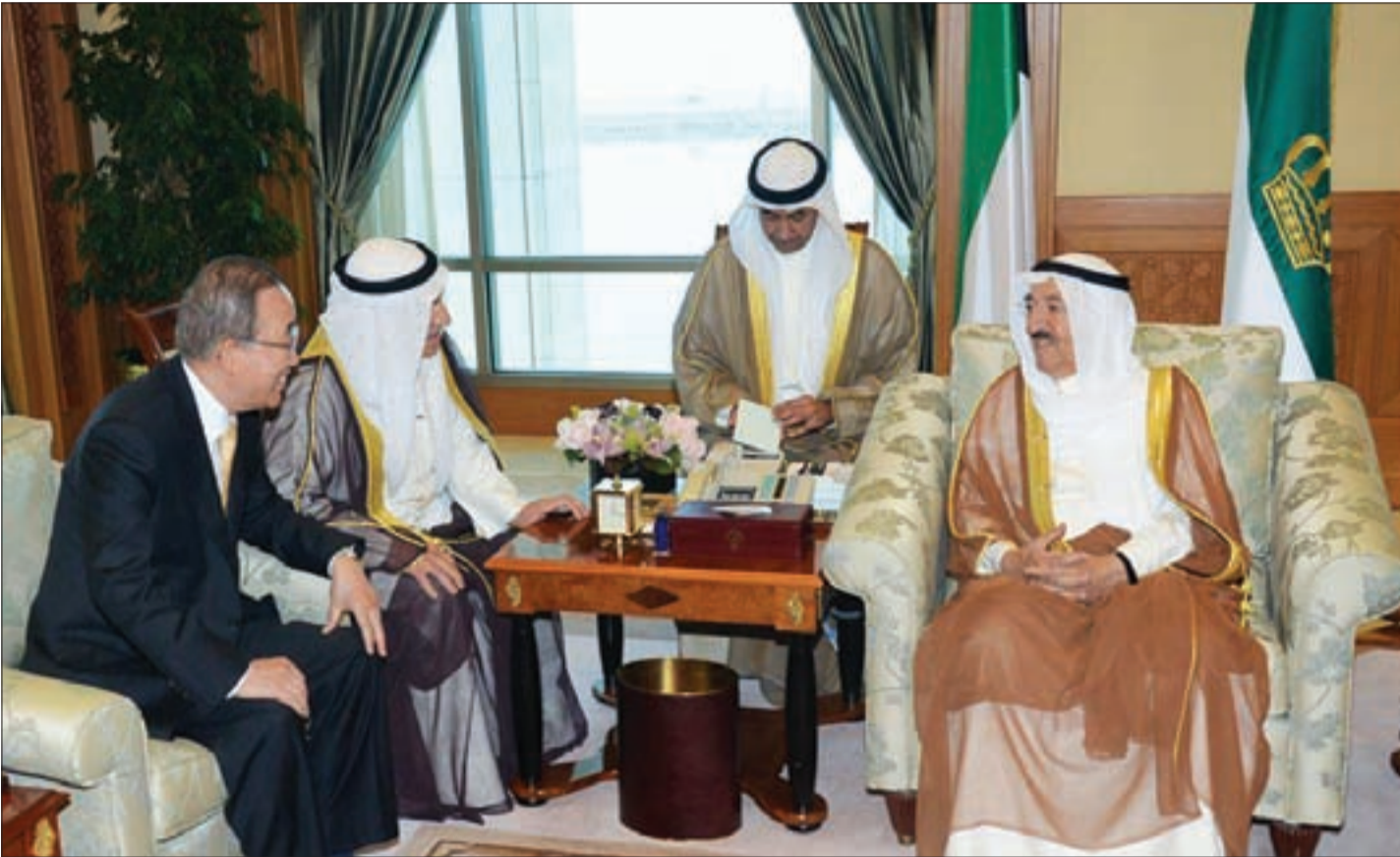
حديث مون عن تمديد المفاوضات شهرين إضافيين.. تمديد للحرب اليمنية

و«أنصار الله» و«حزب المؤتمر»، خصوصاً في ضوء الشروط التي تحاول السعودية فرضها، والانقلاب على أي إيجابية تتحقق، وهذا ما دفع بان كي مون لزيارة عاجلة للكويت، بعد تراجعه المهين عن وضع السعودية على القائمة السوداء في قتل الأطفال اليمنيين، وتخريب البنى التحتية في الغارات، إلا أن الزيارة لم تكن منتجة، ولم تفرض على السعودية حتى وقف النار، والتي تستغل الصمت والتواطؤ الدوليين، إلا أن كل ما حققه الأمين العام للأمم المتحدة لا يعدو عن كونه تمديداً للحرب من خلال الحديث عن تمديد المفاوضات لشهرين إضافيين، على أمل ردم هوة الخلافات، على قاعدة إقرار خريطة طريق للمباديء والالتزام بوقف الأعمال القتالية. في المقابل، تجزم مصادر يمنية بأن الشروط المملدة من السعودية غير قابلة للتحقق، لأنها تعتبر فرض استسلام، لاسيما استبعاد السيد عبد الملك الحوثي وعلي عبدالله صالح من الحياة السياسية، وحل اللجان الثورية العليا واللجان التابعة لها و«أنصار الله»، بالتوازي مع عملية الانسحاب وتسليم السلاح وإلغاء الإعلان الدستوري.