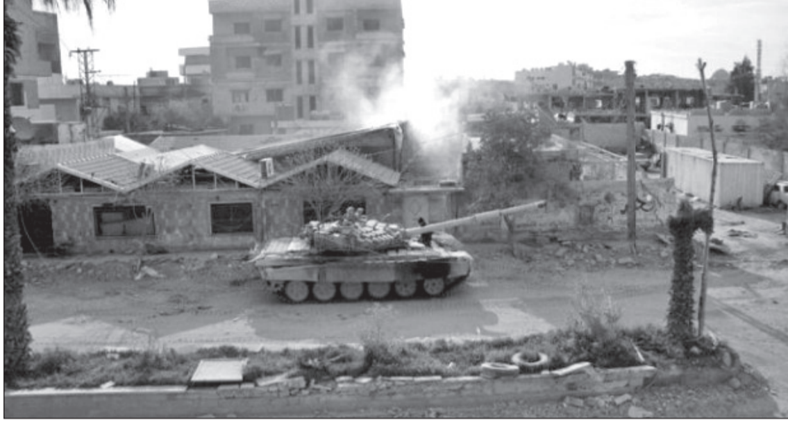
دبابة للجيش السوري تدك معقل الإرهابيين في ريف حلب

الأقوى فيها، بينما أميركا ومعها تركيا والسعودية هي الأضعف. قرأت أميركا جيداً نتائج التدخل العسكري الروسي في سورية، فأدركت أنه فرض واقعاً ميدانياً جديداً، وأن روسيا أصبحت رقماً هاماً فيها، ويصعب تجاوزها، ما دفع بأميركا لقبول بمشروع الهدنة الذي طرحته روسيا، والتي كانت تسعى من خلاله التمهيد للدخول في المرحلة الانتقالية (حكومة موسعة وإجراء انتخابات برلمانية يسبقها تعديل للدستور) التي تم الاتفاق عليها في فيينا، لكن أميركا كانت تهدف إلى شيء آخر، وهو