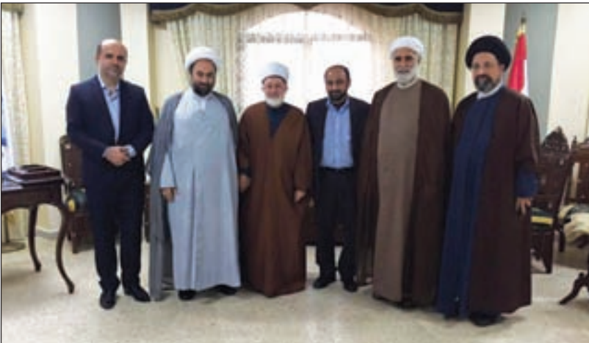
وفد جامعة المصطفى في مكتب الشيخ جبري في بيروت