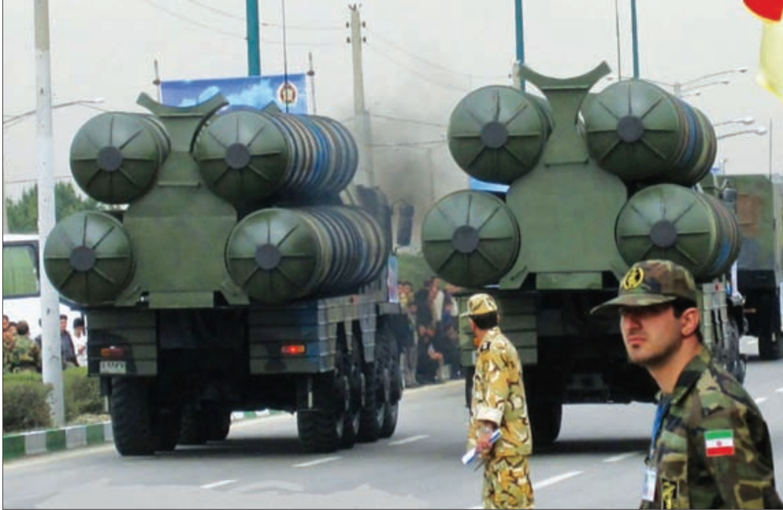
روسيا بحاجة إلى إيران القوية.. وغير الخاضعة للهيمنة الأميركية

تتوسّع مروحة التعاون الروسي - الإيراني على المستويات العسكرية والاقتصادية والسياسية وفق منظومة تبادل أوراق القوة لتأمين الدفاع الذاتي لكلا الدولتين اللتين تعرضتا للعقوبات الاقتصادية والحصار السياسي من أميركا وحلفائها، وصولاً لإثارة التوترات الأمنية، ومحاولة السيطرة على الدول الحليفة لروسيا وإيران (سورية وليبيا واليمن..).