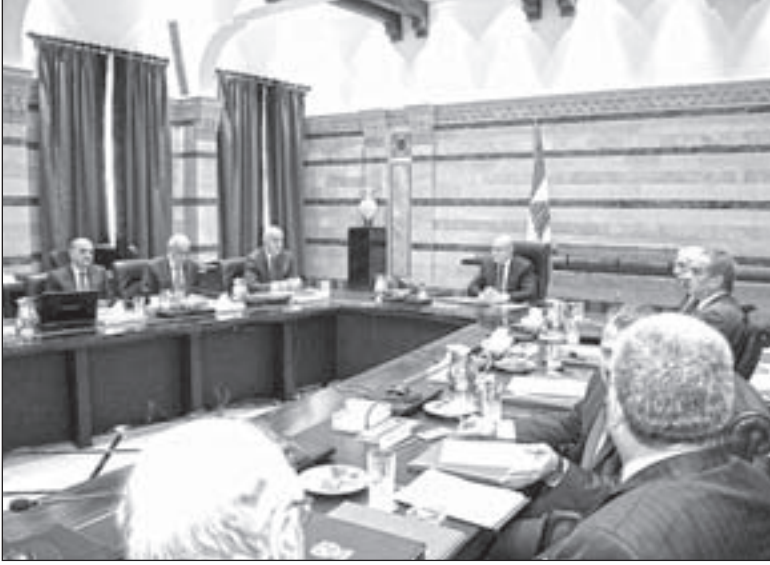
الرئيس تمام سلام مترئساً جلسة مجلس الوزراء

لم ينجح مجلس الوزراء اللبناني في جلسته الأخيرة التي استغرقت أكثر من خمس ساعات، سوى في التمديد ساعات إضافية لإخراج بيان «فعل الندامة» للمملكة العربية السعودية ودول الخليج، ولم يأت البيان بما يرضي اللبنانيين، ولا السعوديين، فكان لا بد من مؤتمر صحفي في «بيت الوسط»، أطلق خلاله الرئيس سعد الحريري «وثيقة تاريخية» تثبت انتماء لبنان العربي، والحرص على أفضل العلاقات مع «أهل المكرمات»، بحضور أبطرة المال من شركاء المرحوم والده، الذين لا يرى الشعب اللبناني في بعضهم سوى وجوه غيلان من بعدهم الطوفان.