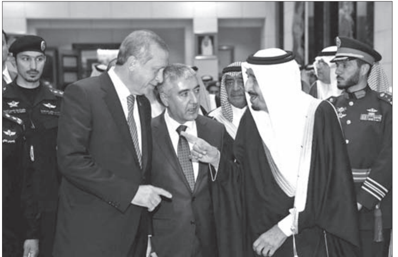
السعودية وتركيا مستعدتان لمغامرة إضافية بمصير الشعوب والبلدان

ومن سلوكيات الجنون القاتلة تلك رغبة أردوغان الحقيقية واستعداده لتدخل بري في سورية لاستنقاذ مسلحيه، لولا القرار الأميركي