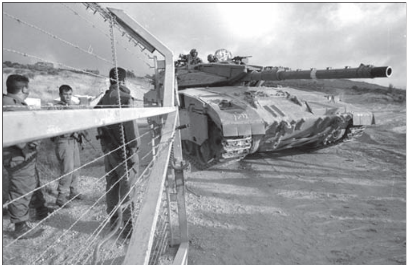
جنود صهيانية عند الحدود مع الجولان المحتل