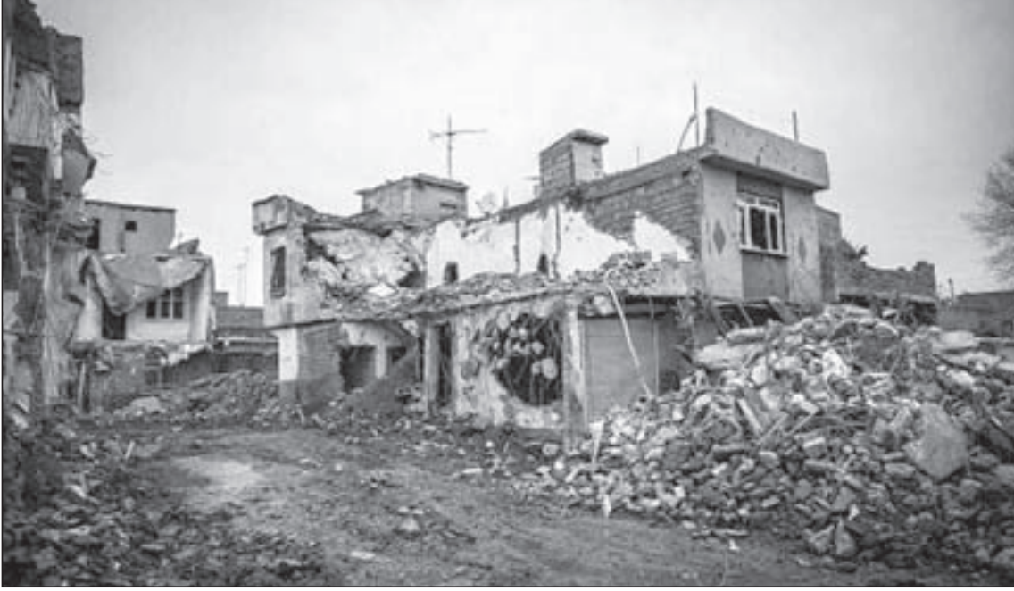
دمار أصاب بلدة سور التابعة لدير بكر جراء قصف الطائرات التركية لجنوب شرق البلاد

الوشاية بزملائهم إن أتوا بكلمة تنال من أردوغان ورموز سلطته، ما أدى إلى وصف النظام ورأسه بأعشى الأوصاف الديكتاتورية.