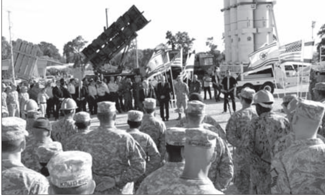
مناورات «جونيفر كوبرا» هدفها اختبار التصدي لصواريخ سورية وإيران والمقاومة

عن إيران فإن السعودية لن تجد بديلاً أمامها عن مساعدة «إسرائيل»، ووفق ما سرّب من معلومات هناك مشاركة لـ «إسرائيليين» بصفة خبراء عسكريين واستخباراتيين.