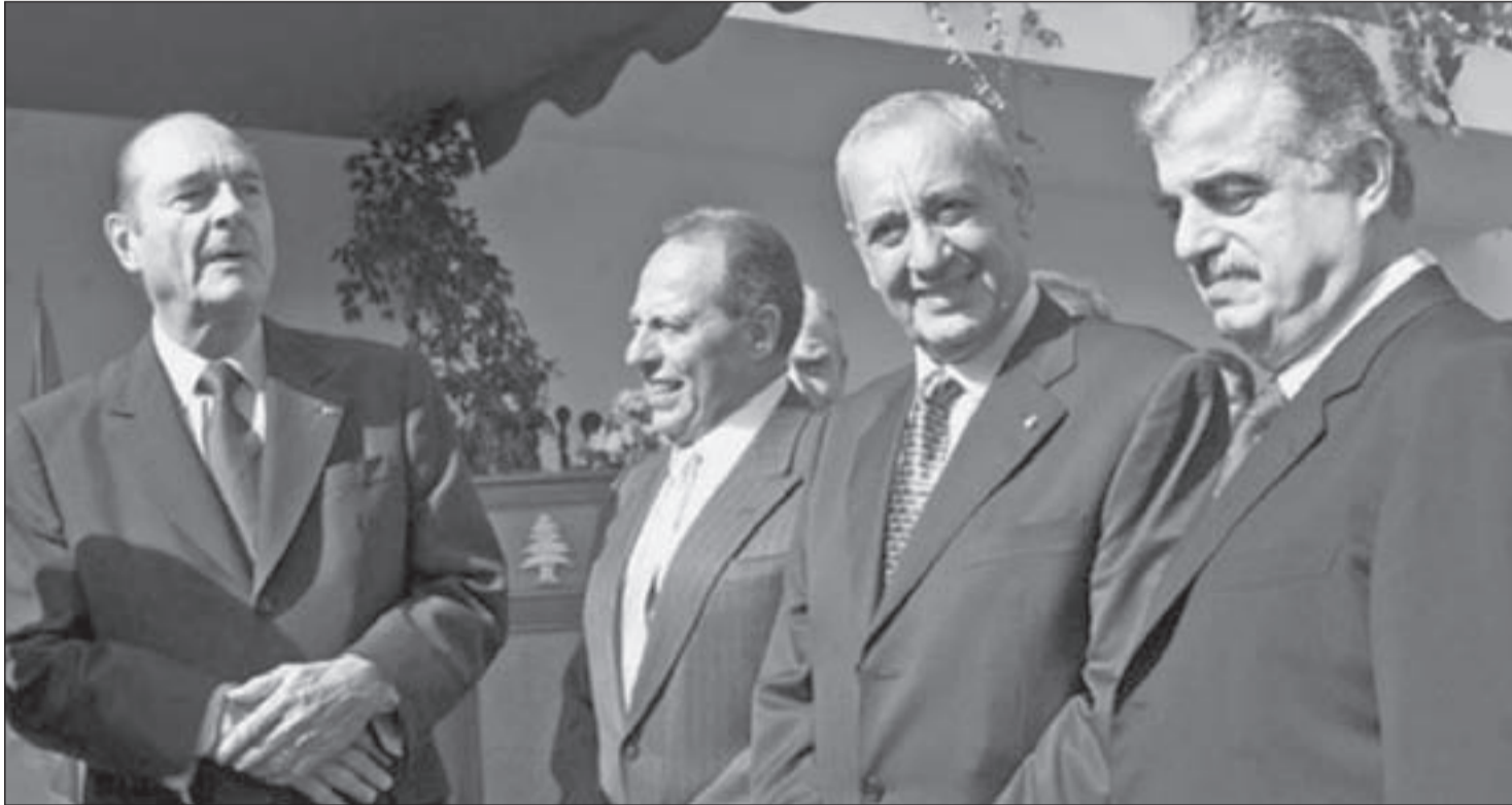
من القمة الضرورية في لبنان

بعد يومين من اتصال الرئيس الفرنسي جاك شيراك، اتصل برئيس الجمهورية المنتخب العماد إميل لحود، السفير الفرنسي في لبنان، طالباً لقاءه، فرد الرئيس لحود بالقول: لا يمكنك أن تراني، فأنا لم أعد قائداً للجيش، ومن استلم مكاني هو رئيس الأركان، وما زلت رئيساً منتخباً، ولم أستلم مهامه الدستورية بعد، فبأي صفة سنلتقي؟ فرد السفير الفرنسي: إذا، حينما تتسلم مهامك الرئاسية رسمياً، نلتقي.