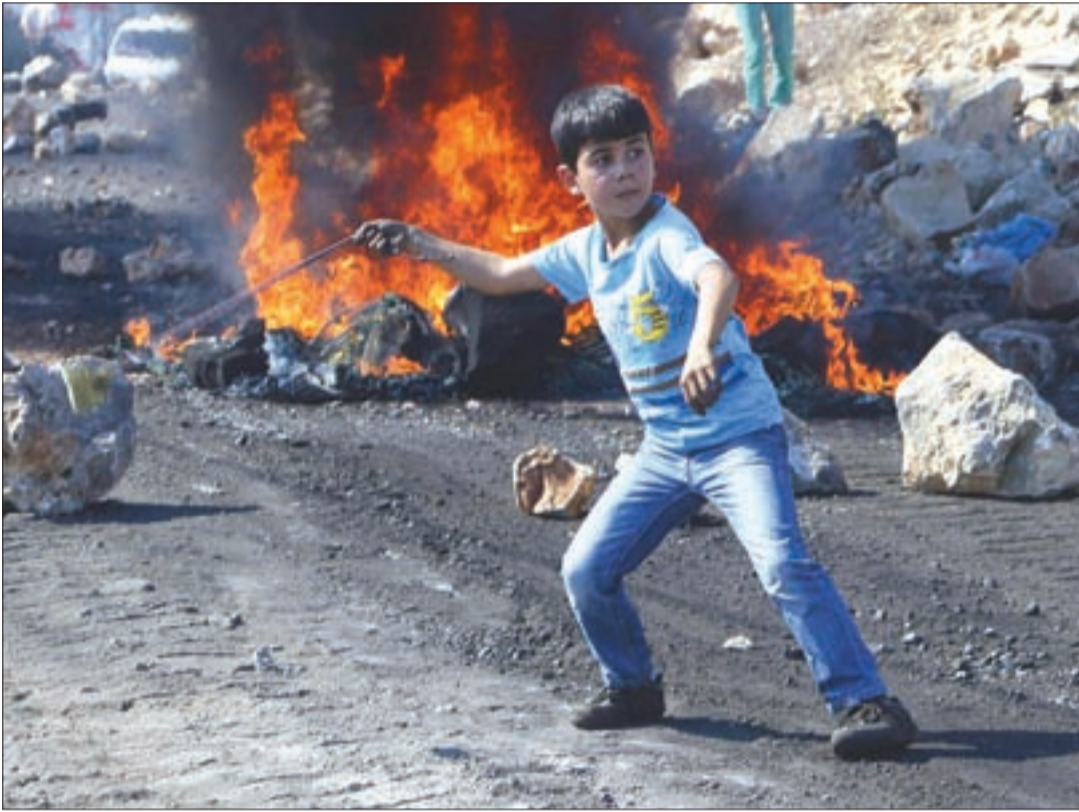
أطفال الحجارة: على المعهد باقون

العليا، للاتفاق على استراتيجية سياسية وطنية موحدة، والتوقيع على نظام روما المتعلق بمحكمة الجنايات الدولية. إن الانتهاكات الصهيونية المستمرة في القدس أخذت تطال الحياة اليومية الفلسطينية بكامل تفاصيلها، فلا يمر يوم دون سقوط المزيد من الضحايا الفلسطينيين، بما يستدعي وضع استراتيجية فلسطينية بهدف ضرب المشاريع الصهيونية التي تستهدف المقدسات الإسلامية والمسيحية، بهدف خلق صراع ديني يمهّد لإعلان ما يسمى بـ«يهودية الدولة الإسرائيلية»، وذلك من خلال تصعيد المقاومة الوطنية والشعبية ضد الجدار والاستيطان والاحتلال.