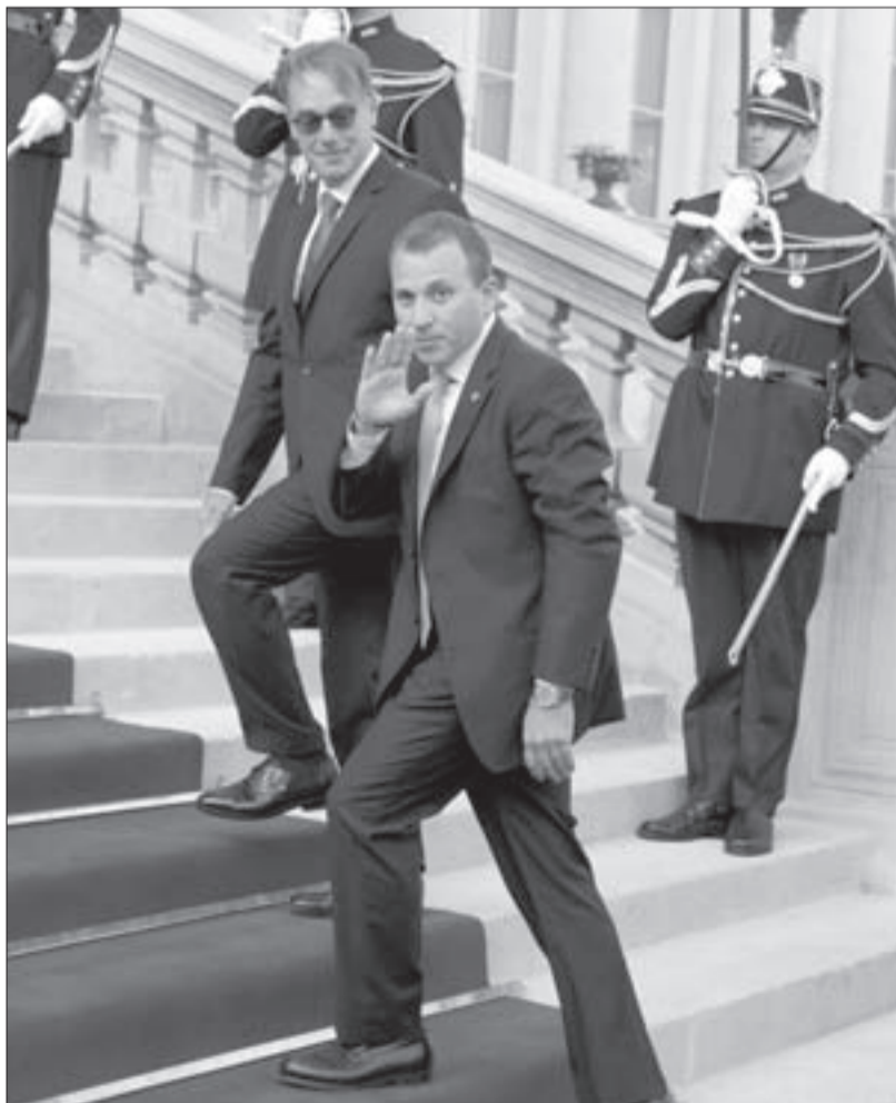
وزير الخارجية اللبناني جبران باسيل قبيل دخول للمشاركة في مؤتمر باريس (أ.ف.ب.)

«داعش» للقضاء عليها نهائياً يعزز من موقع إيران والنظام السوري، ومصر ترفض أن تنحصر الحرب بـ«داعش»، بل يجب أن تشمل كافة المنظمات التي تصنف إرهابية، لتشمل «جماعة الإخوان» وسواها من المنظمات التي تعبت بامن سيناء. ولعله من قبيل الصدفة أن ينقسم اللبنانيون في آرائهم من هذا التحالف