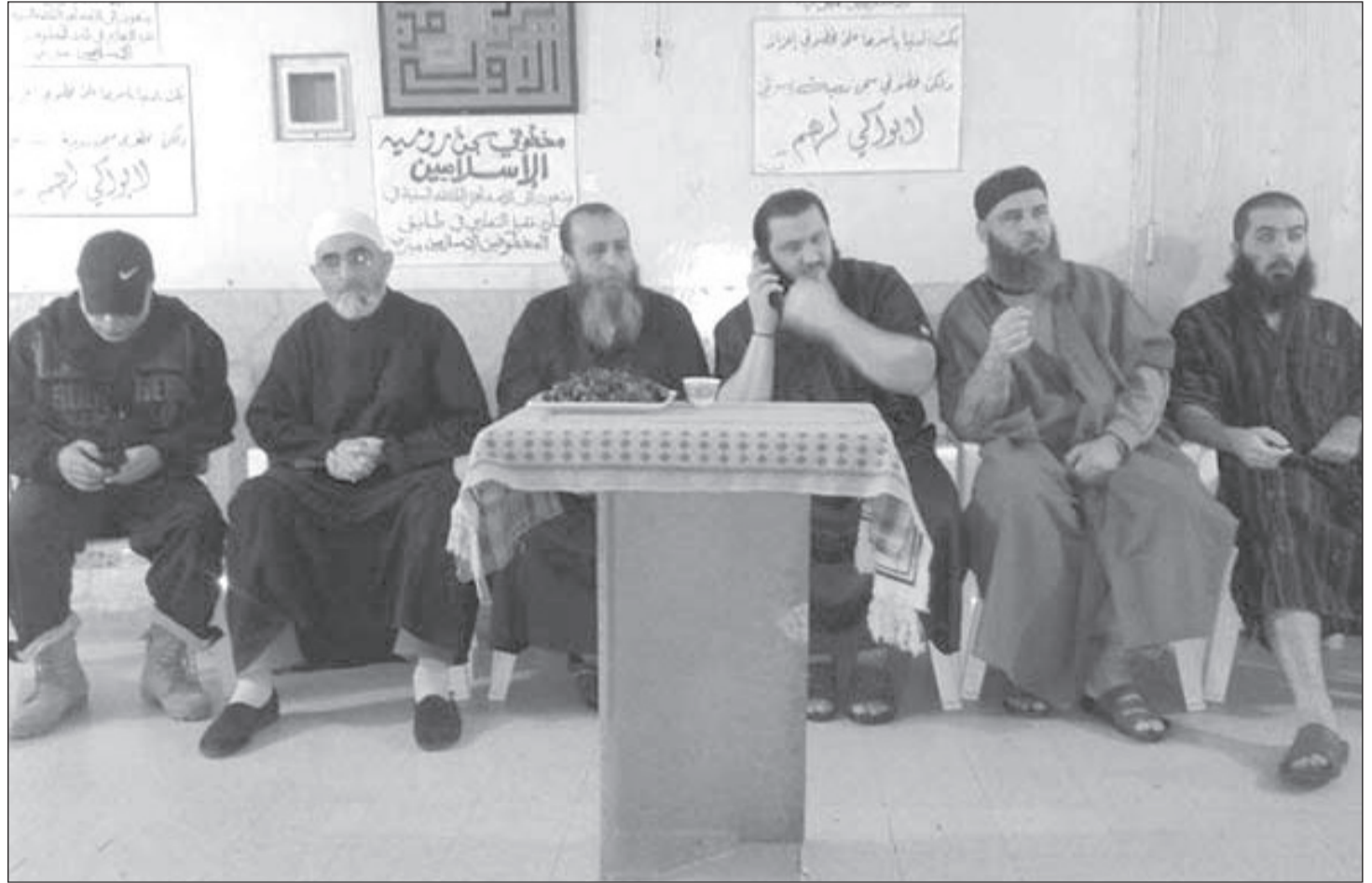
الصعوبات القانونية أجبرت على استبعاد الحل الذي يسيء إلى مكانة الدولة وهيبتها