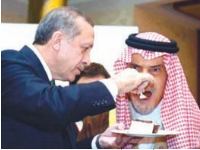
تركيا لن تقبل بأي حال من الأحوال تسليم القيادة لخصمها اللدود - السعودية

أردوغان غولدين بالإرهابيين عندما قال لأوباما: «كما نحن نعيد إليكم المطلوبين من الإرهابيين فعليكم أن تفعلوا الشيء ذاته معنا»، كما نقلت الصحف التركية عن لقاء الرئيسين.