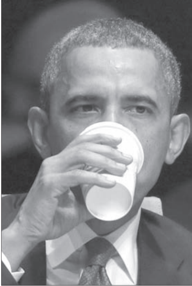
لماذا يحشد أوباما لمحاربة «داعش» دون «جبهة النصرة».. مع أنها مصنفة إرهابية؟

مرة جديدة: على حلفاء سورية؛ من طهران إلى موسكو، ومن دمشق وبيروت إلى بكين، تطوير أسلوب المواجهة مع حلف أعداء دمشق، الذين هم في حقيقتهم معادون لكل تقدم إنساني.