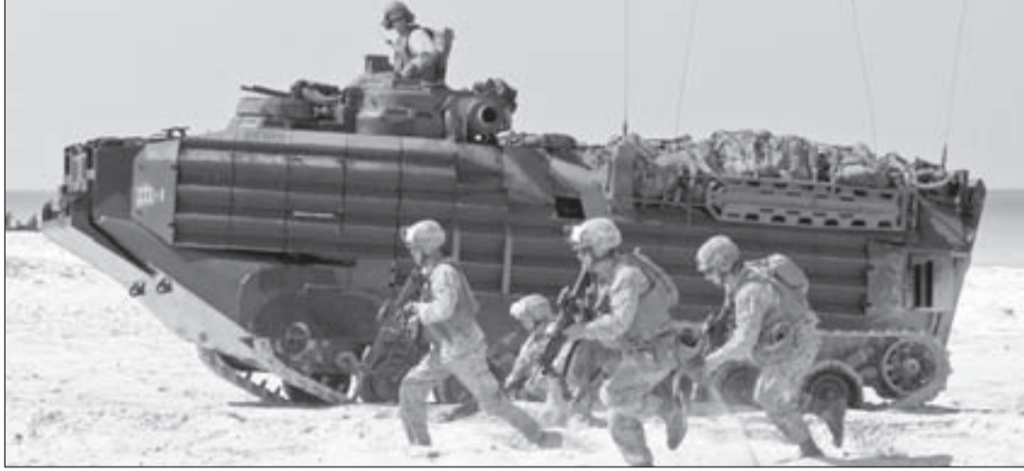
15000 جندي غربي سيتوجهون إلى الأردن نهاية الشهر الجاري بانتظار بدء إشارة انطلاق الضربات الجوية الأميركية ضد «داعش» في العراق وسورية

«أسر-300»، التي لم تؤكد موسكو أو تنف حتى الساعة وصولها إلى سورية، كشفت التقارير عن استلام دمشق دبابت «T82» الروسية، وأعدت حربية لها مزايا حربية عالية، وقنابل موجهة، مرفقة بفريق من الخبراء العسكريين المولجين حصراً بتشغيل منظومة الصواريخ، كما كشفت النقاب عن حشود عسكرية روسية لافتة، واستنفاً عالي المستوى لأساطيلها في الموانئ السورية، بالتزامن مع استلام دمشق شحنات من الصواريخ الإيرانية المتطورة - لم تحدد ماهيتها - وقاذفات ضد الدروع، وأجهزة اتصالات ورصد تم إلحاق دفعات منها باتجاه جبهة دير الزور، حسب إشارة التقارير. عسكريين، فإن الميدان السوري على موعد مع مفاجآت عسكرية «من العيار الثقيل» على وقع أولى إشارات الحصار المحكم الذي بدأ الجيش السوري بفرضه على محافظة دير الزور، وحيث تنبئ المستجندات الميدانية القادمة بحسم إحدى أهم الجبهات الصعبة في سورية، مرفقة بحرق «إسرائيلي» لجدار العمليات العسكرية السورية كشفه موقع «ديكا» الإسرائيلي، وفيه أن «إسرائيل ستشرع قريباً بخلق منطقة أمنية عازلة في الجولان، تهدد من خلالها دمشق، وحزب الله في جنوب لبنان».