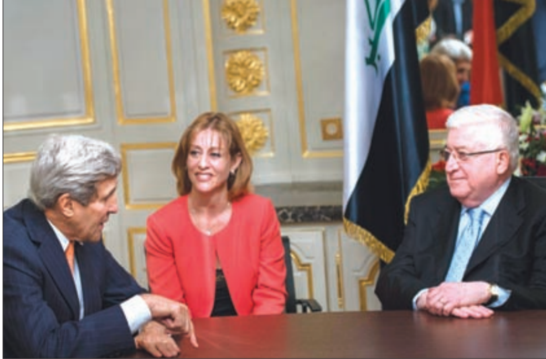
الرئيس العراقي فؤاد معصوم ووزير الخارجية الأميركي جون كيري خلال لقاء جمعتهما في السفارة العراقية ببغداد (أ.ف.ب.)

عادت أميركا على أجنحة «داعش» فأسقطت العراق من جديد بطلعات جوية مدفوعة الثمن من السعودية، وتحاول محاصرة سورية للتدخل فيها من نافذة قتال «داعش»، وملاحقتها بالالتفاف على القرار الدولي، فاستبعدت إيران وروسيا من مكافحة الإرهاب.