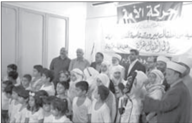
الشيخ جبري: جيل القرآن الكريم هو الذي سيحرر فلسطين

العتاء، قامت دورات «براعم الإيمان» بتربية الأجيال الناشئة على حب الله عز وجل، والرسول عليه الصلاة والسلام، والتزام أوامرهما بوجود الوحدة بين المسلمين، وغرس حب الوطن في نفوسهم. من جهته لفت أمين عام حركة الأمة: الشيخ د. عبد الناصر جبري، إلى أهمية زرع العقيدة الإسلامية الصحيحة، والإسلام المعتدل الذي جاء به نبينا عليه الصلاة والسلام، في نفوس الأطفال الناشئة، لنحصد جيلاً يخاف ربه ويحارب كل ما يشوه الدين ويعتدي على كرامة الإنسان والوطن، متمنياً من المولى جل وعلا أن يكتب لهذا الجيل تحرير بيت المقدس. وفي الختام تم توزيع الهدايا والجوائز على الطلاب المشاركين في الدورة القرآنية.