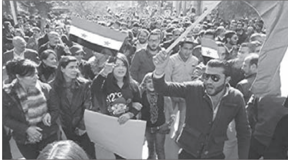
مسيرة تضامنية أمام كلية الحقوق بجامعة دمشق تأييداً للثوابت الوطنية للوفد السوري في مؤتمر «جنيف 2»

تحديد مصير اللاجئين الفلسطينيين عبر إلغاء حق العودة، وتوزيعهم على الكيانات والأقاليم الجديدة، بعدما أعلن بعضهم شراكتهم في ثورات «الإخوان» وتحالفهم مع قطر وتركيا، وأول الغيث التوطين المؤقت غير المستقر، عبر تأشيرات العمل القطرية (نحو 40 ألف تأشيرة) والمظاهرات الشبابية في المخيمات لتسهيل الهجرة، وسيكون دور الجماعات التكفيرية تفجير المخيمات كما حصل في