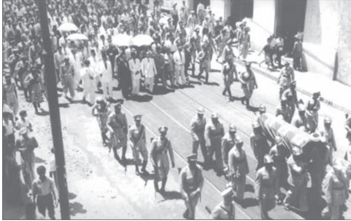
المفتي الشيخ محمد توفيق خالد نحو مثواه الأخير

الشرعية تشيد، وتخرج علماء ومرشدين وأدباء هم ملء عين الوطن وثمار شهية تتدلى من شجرة مباركة فروعها باسقة وأصلها ثابت في الأرض.