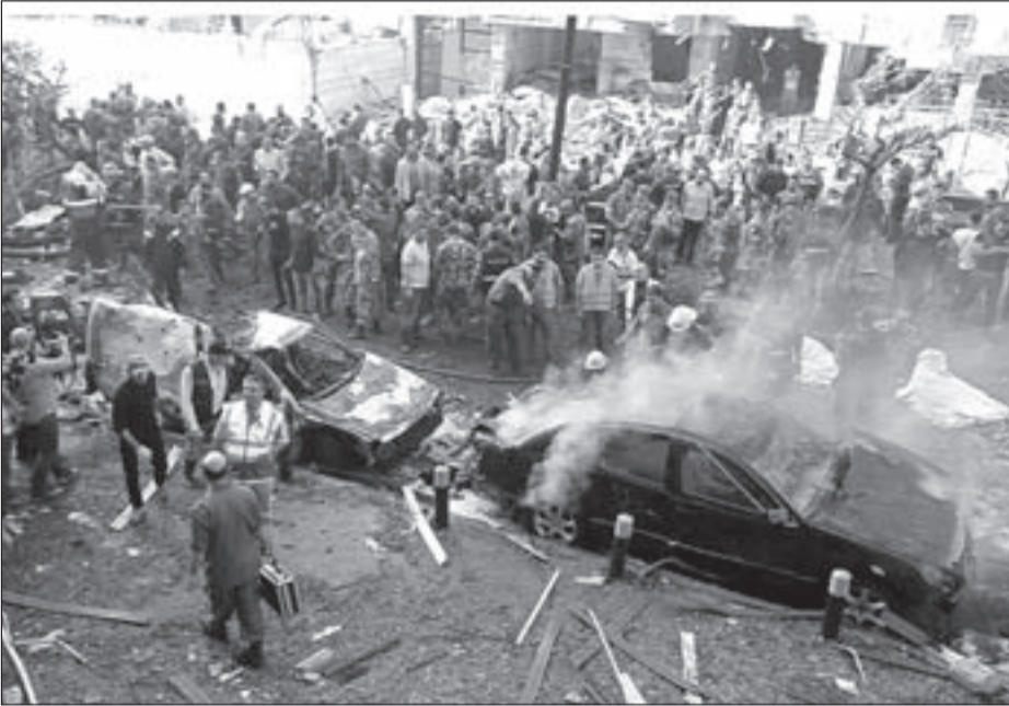
القوى الأمنية تنتشر حول مكان وقوع الانفجار في حارة حريك

مواجهة الانتحاريين طويلة الأمد، وهي لا ترتبط بوجود «حزب الله» في سورية، ولا ترتبط بالقاعدة المركزية لتنظيم «القاعدة»، بل بتنظيمات تكفيرية تحمل فكر «القاعدة» وتتنامى ما دام التكفير ينمو، وتنتشر ما دام التمويل متوفراً، وتعيث في الأرض كفرة وقتلاً ما دامت تمتلك أدوات موت متنقلة ومزمنة بالموت، لذلك، لم تعد عملية إعادة الانتشار الأمني لعناصر الحزب في الضاحية والقرى المستهدفة - سواء بلباسهم المدني أو العسكري - كافية، ولا الأجهزة الإلكترونية والكاميرات الكاشفة للمتفجرات مجدية، لأن المطلوب إعادة انتشار مخابراتي وأمني حول مناطق «التصنيع والتصدير»، سواء للسيارات المفخخة أو لحاملي زناير الانتحار داخل الأراضي السورية المحاذية للحدود، أو ضمن الأراضي اللبنانية وصولاً إلى محيط المخيمات الفلسطينية، التي تعيش داخل بعضها خلايا إرهابية منورطة في إدخال وتحضير وإرسال السيارات المفخخة، ولا يمكن لأي فصيل فلسطيني ادعاء أن المخيمات ممسوكة، لأن ضياع السلطة على الأرض بين «القوى والفصائل» هو الذي «أضاع الطاسة» في المخيمات، على أمل أن تبقى الأرض ممسوكة من الدولة والحزب معاً، عبر التعاون الكامل والمثالي والاحترافي مع الأجهزة الأمنية الرسمية، وأن يؤدي هذا التعاون ثماره في ضبط التفتت ضمن الحد الأدنى، عبر التحقيقات التي كشفت وتكشف أوكار «صناعة الموت»، قبل أن تثور ثائرة الناس المستهدفة مناطقها، وتحصل رداً فعل عفوية ومبررة كتلك التي حصلت على طريق اللبوة - عرسال بعد انفجار الهرمل الثاني.