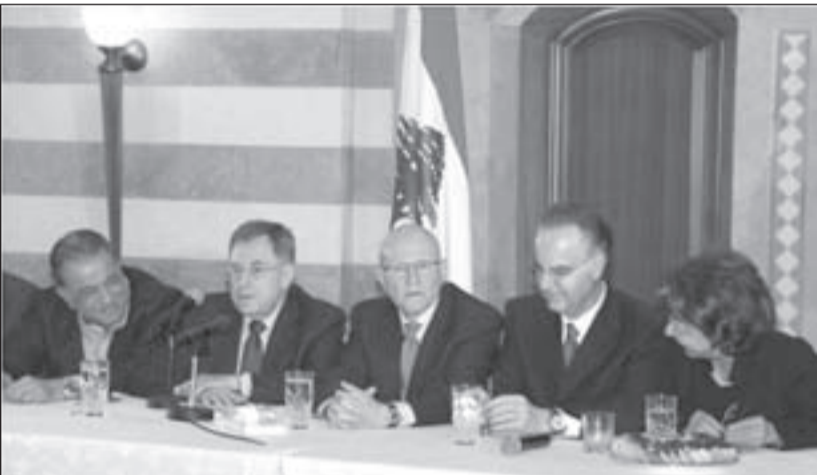
الرئيس المكلف تمام سلام في «بيت الوسط»، محاطاً بقوى 14 آذار

يكابر الرئيس المكلف تمام سلام بالاعتراف بفشله في تشكيل حكومة، وفق الموصفات التي اشترطت عليه من قبل الذين زكوه لهذه المهمة، وفي هذه الظروف غير العادية.