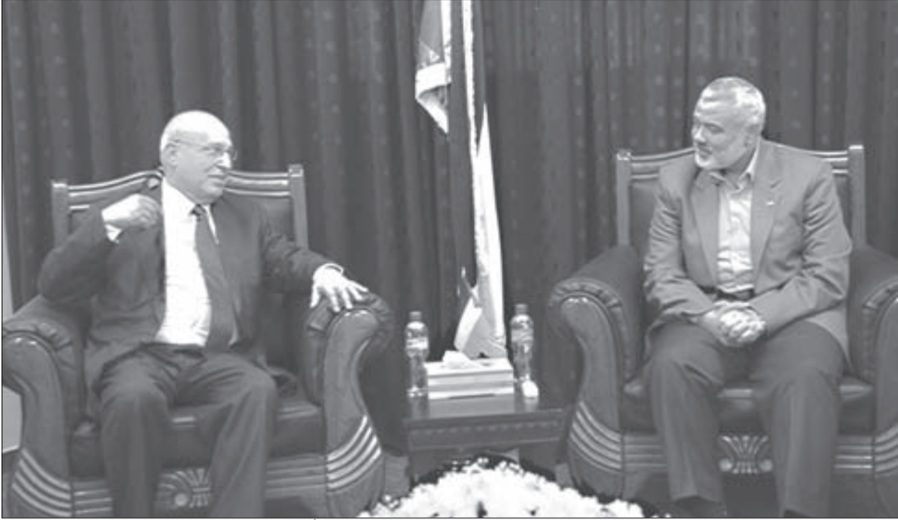
رئيس الحكومة المقالة في غزة إسماعيل هنية وتبيل شعث (أرشيف)

الداخلي لحركة فتح»، وأوضح أن الحركة تجري اجتماعات متواصلة من أجل الوصول لرؤية واضحة لتنظيم البيت الداخلي لفتح في قطاع غزة.