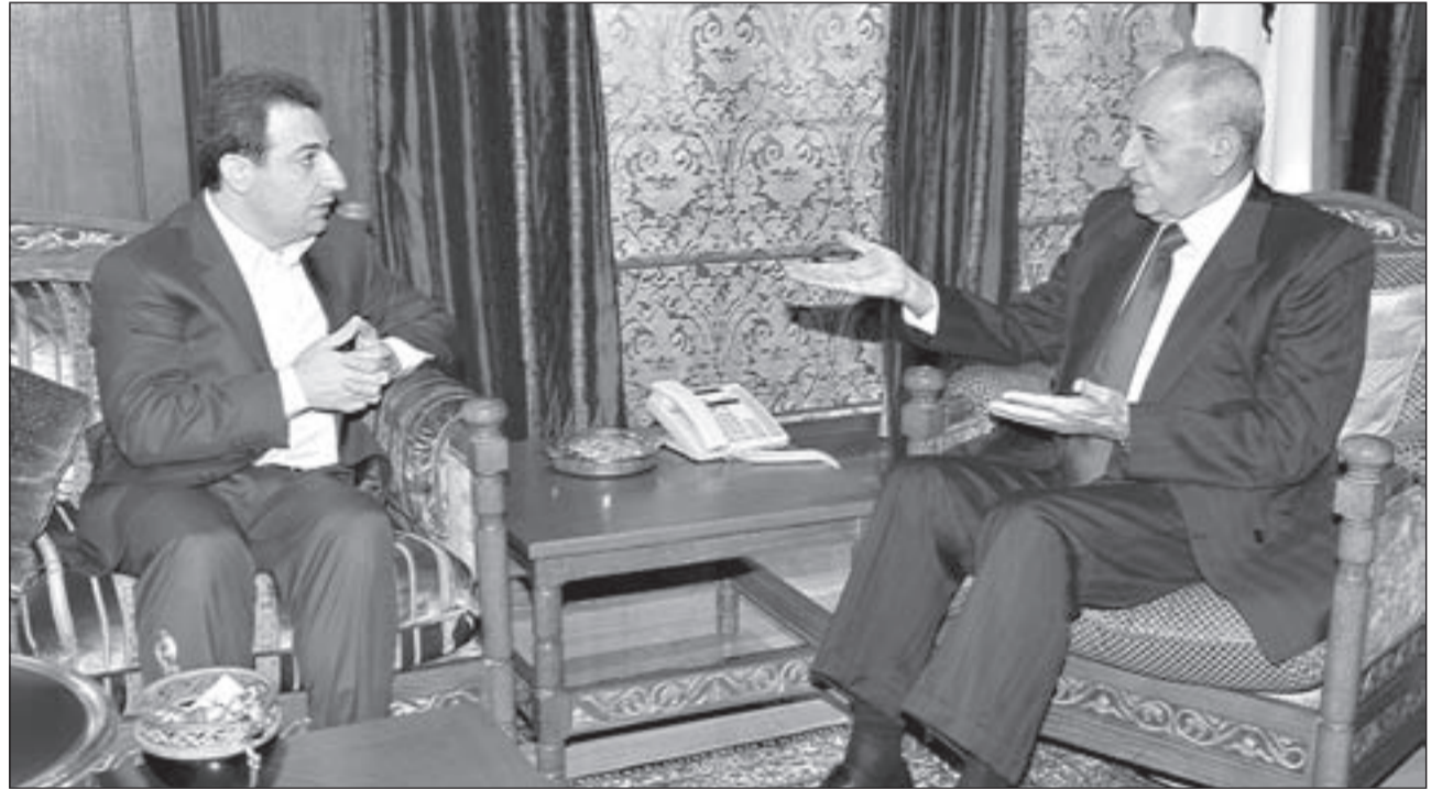
الرئيس نبيه بري مستقبلاً الوزير وائل أبو فاعور موقفاً من النائب وليد جنبلاط

السياسي في تشكيل حكومة يرأسها شخص محسوب تماماً على هذا الفريق غداة الإطاحة السعودية بحكومة نجيب ميقاتي، الذي لم يقو بدوره على التصدي للهجمة الإعلامية والسياسية عليه، ولو أنه صمد وانتظر حتى موعد جينف وتبدل معالم الجو السياسي في المنطقة لكانت الأمور على غير ما هي عليه الآن. لكن ورغم ذلك فإن الفريق الأذاري يعتقد أن الجالس في السراي الحكومي هو الحاكم، ولو بصيغة تصريف الأعمال، فالوزارات تعمل بشكل عادي، والرئيس يداوم في مكتبه، أما الجالس في المصيبة فليس بمقدوره فعل شيء.