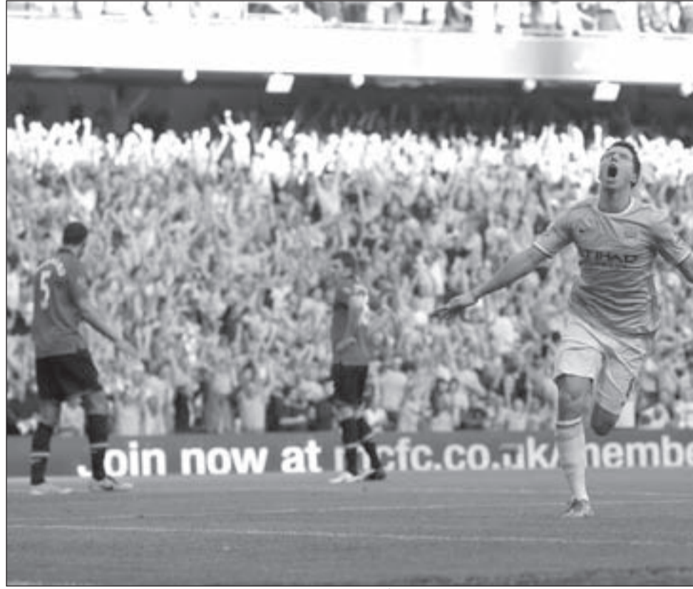
نجم سيتي الفرنسي سمير نصري يحتفل بتسجيله في مرمى يونايتد

فقط من تولي موز المسؤولية خلفاً لمواطنه المعتزل فيرغيسون.