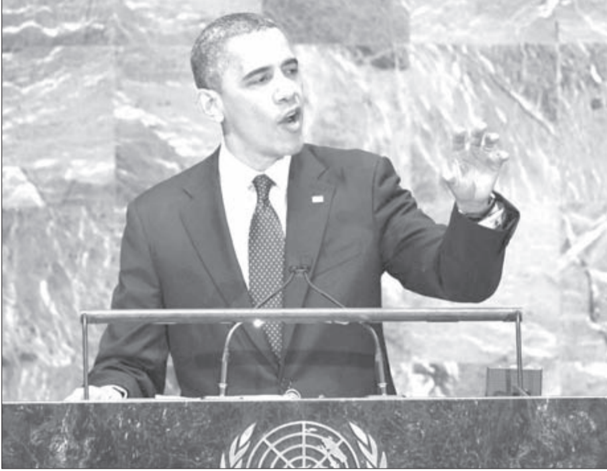
الرئيس الأميركي باراك أوباما خلال إلقاء كلمته أمام الجمعية العامة للأمم المتحدة في نيويورك

حرب تصفية على الآخرين، فكشفت هذه الجهات ضعف «الجيش الحر»، الذي تهاوى خلال ساعات، وبالتالي فشل الرهان الغربي على هذا الجيش الكاركتيري، الذي أخذت بعض فصائله تناشد الجيش العربي السوري لإنقاذه من براثن «داعش» أو «جبهة النصرة»، التي وجدت نفسها في سباق مع الأولى للسيطرة والتمركز، فكان أن دخلت معارك مع «داعش»، وهو ما أثار هواجس قوى إقليمية ودولية كانت في مقدمها تركيا، التي بدأت الخلافات تعصف في قيادتها على مستوى «حزب العدالة والتنمية»، فكان الحديث الأخير لرئيس الدولة التركية عبدالله غول، الذي أشار إلى خطورة هذا التنظيم الذي أصبح على حدوده مباشرة، مما سيزيد من إرباك الحكومة التركية، التي ستجد نفسها وجهاً لوجه أمام موجة من الإرهاب ستضرب في أكثر من مكان مستقبلاً في تركيا، وبالتالي سيجعلها باكستان جديدة تنشأ الأمن والاستقرار.