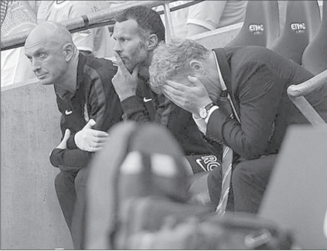
الخيبة على وجه الجهاز الفني ليونايتد