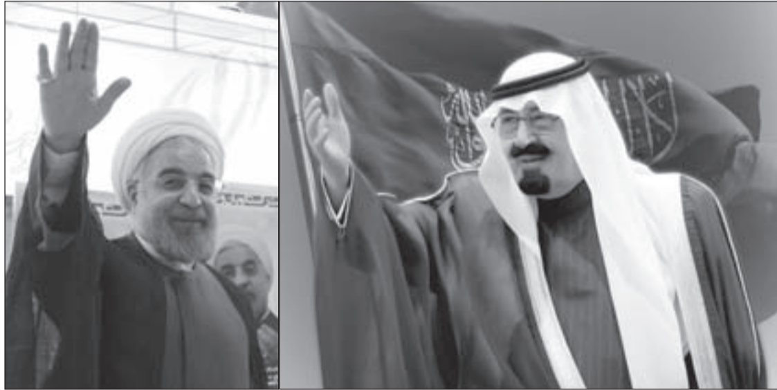
الرئيس الإيراني الشيخ حسن روحاني

إن التفاهم الإيراني - السعودي سيقيض تماماً على الدور القطري الذي انتفخ بسرعة وتم نعيه بإقصاء الحمدين ووضع في ثلاجة العمل السياسي على الأقل في المرحلة الحالية وإعطاء نوع من الدور لسلطنة عمان والسلطان قابوس.