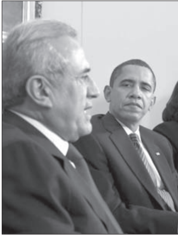
الرئيسان الأميركي باراك أوباما واللبناني ميشال سليمان

دمشق، بينما اليوم يتم السعي للتيان برئيس جمهورية ضعيف لا يملك صلاحيات فاعلة، إلى جانب رئيس حكومة قوي يمسك مفاتيح العلاقات مع الخارج الداعم والموجه، ولا يقبل بأقل من تملك قرار التسلسل على الشأن الداخلي، بحكم الهيمنة