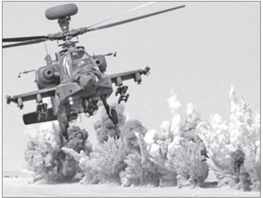
مروحية عسكرية تفرغ مواقع للإرهابيين في سيناء

الموقف السلبي هذا ينسحب على العلاقات مع قطر، التي كانت تعتقد أن المال قادر على شراء كل شيء، بما في ذلك الكرامة الوطنية، من دون أن تأخذ العبر من الدرس الليبي، حيث دفعت 4 مليارات و500 مليون دولار للسيطرة على المجلس التأسيسي، وقد ضاعوا هباءً في السياسة، وإن أنتجوا خراباً ودماراً وفساداً، ومع ذلك تريد السلطات المصرية