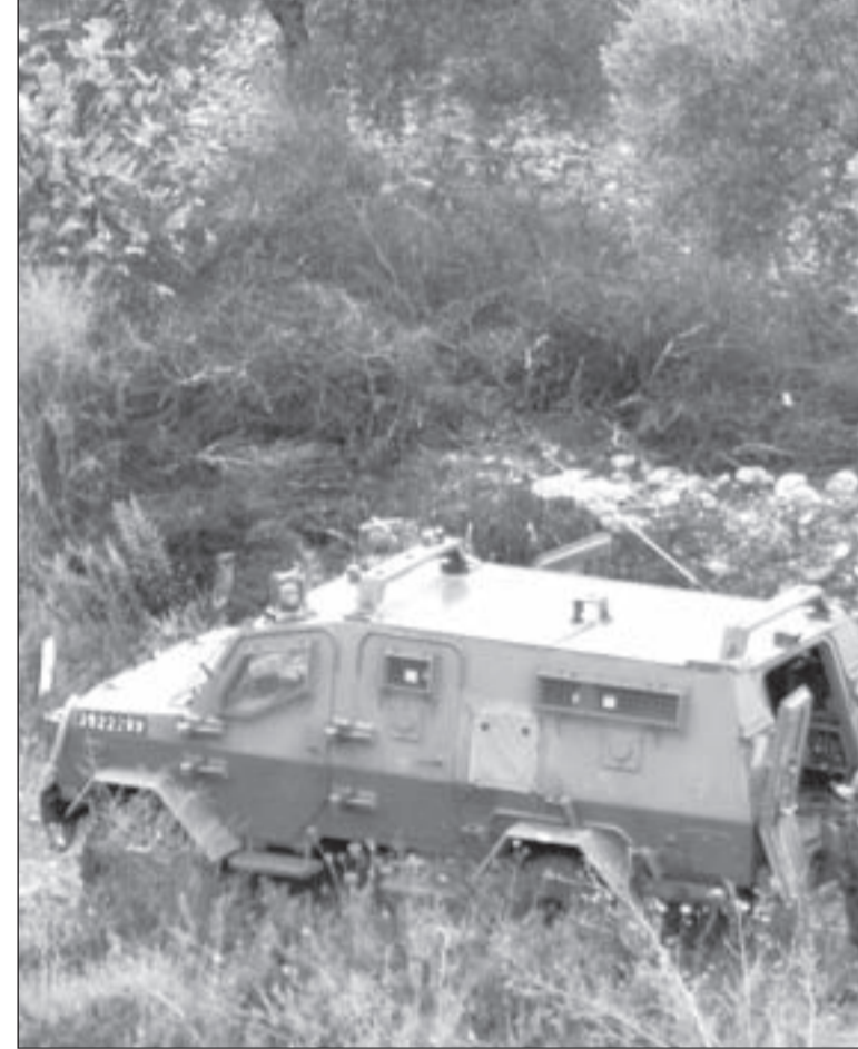
جنود صهاينة ينقلون زميلهم المقتول في قلقيلية

ولو أن جهداً من أي نوع قد بذل في البحث عن صيغة لتغيير الحالة القائمة، لما التقى بغير خيار واحد،