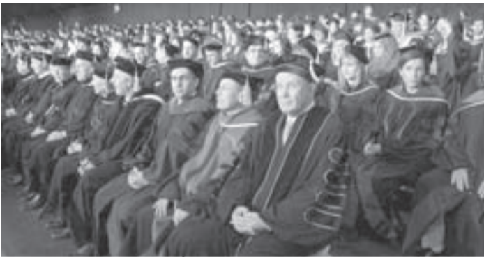
الوزير السابق عبد الرحيم مراد محاطاً بالخيريين

عقولكم المصرف الذي لا ينضب مورده، وليس مضطراً إلى حسابات الربح والخسارة، لأنكم بمؤهلاتكم العلمية والشخصية والتكوينية، في موقع الراح دائماً إن شاء الله، مؤكداً أن «الوطن آت لا محالة، وأنه سينتصر على حساب الأصفافات السياسية المفتعلة، وعلى الجميع أن يعمل من أجل الوطن والمواطنين».