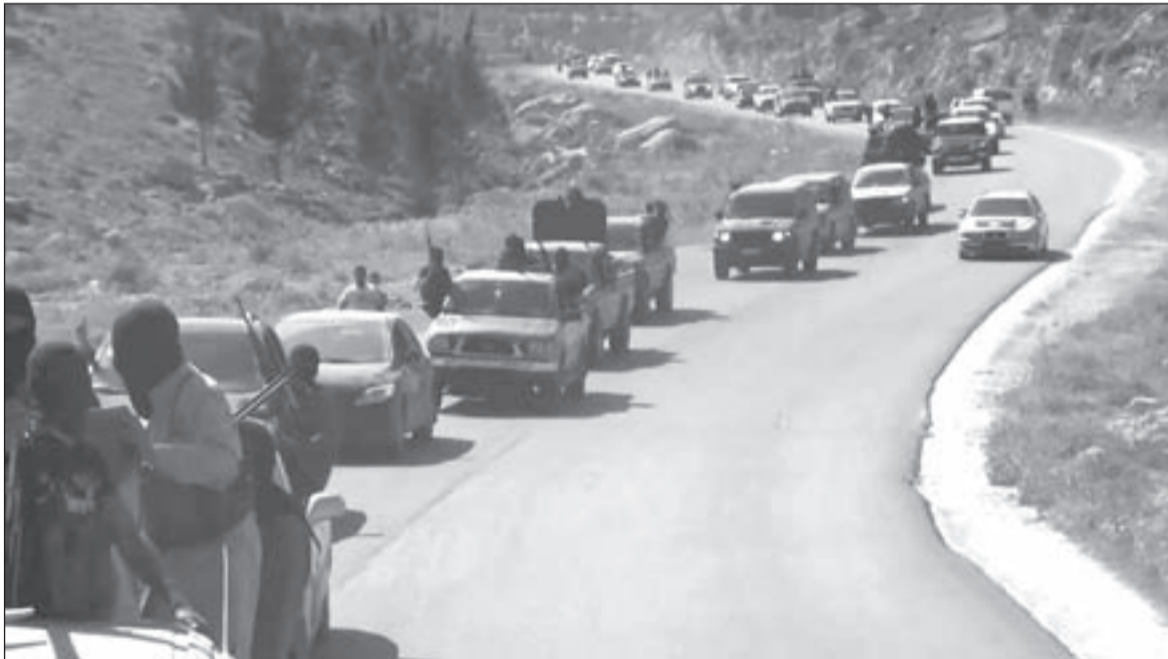
مسلمو تنظيم «دولة الإسلام في العراق والشام» خلال توجههم لقتال «الجيش الحر» في شمال سورية

يستحضر هذا الصحافي تلك الصورة ويسقطها على تلك المعارضات السورية المسلحة، وعلى أولئك المتحمسين لهم في أكثر من مكان، خصوصاً في لبنان، حيث تشكلت حالة من الهمجية النازية التي أخذت بالتكوّن منذ أن كان الدردبيس عبد الحليم الخدام يستقبل العديد من الساسة الذين عفروا وجوههم على عتباته طمعاً بمنصب أو مركز أو ثروة، وهام الآن ينحازون ويميلون بقوة إلى حاخامات فتاوى «جهاد النكاح»، ليخلص إلى سؤال: ماذا سيفعل هؤلاء بعد أكثر من سنتين ونصف من صمود الدولة الوطنية السورية، وبدء تحول عالمي مذهل لمصلحتها، حتى في الدول الغربية التي ساندت الحرب العدوانية على سورية بكل الأشكال، حيث أخذ العالم يكشف زيف وكذب الادعاءات الغربية والأميركية والخليجية والتركية، لتظهر وسائل الإعلام العالمية مؤخراً