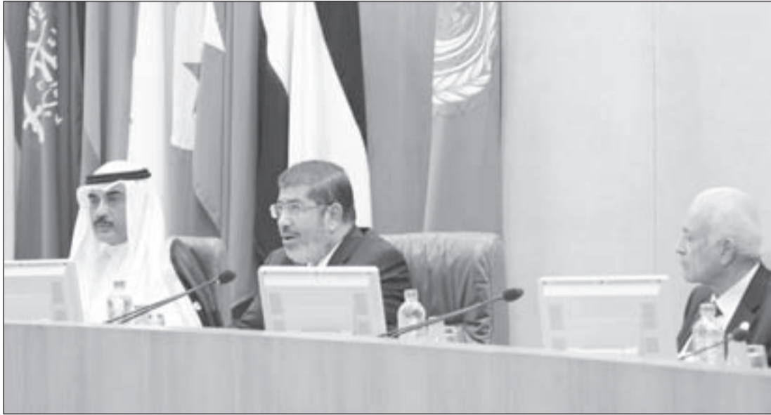
الرئيس المصري د. محمد مرسى خلال اجتماع وزراء الخارجية العرب في مقر الجامعة

بأي حال، فإن ذنبك الخطابين تكاملاً مع الخطاب التركي المتوتر، الذي اتهم سورية بأنها إرهابية وفق ما جاء على لسان رجب أردوغان، وبالتوازي مع الترويج الغربي والخليجي باستحالة مهمة الأخضر الإبراهيمي، ما يعني أن حمام الدم السوري مستمر، وبيات الشركاء كثر، ولا سيما من المستعربين الذين خافوا من افتضاح جرائمهم أكثر، فأوقفوا القنوات السورية عن أقمارهم الإعلامية بطلب من القوى التي تقف خلفهم.