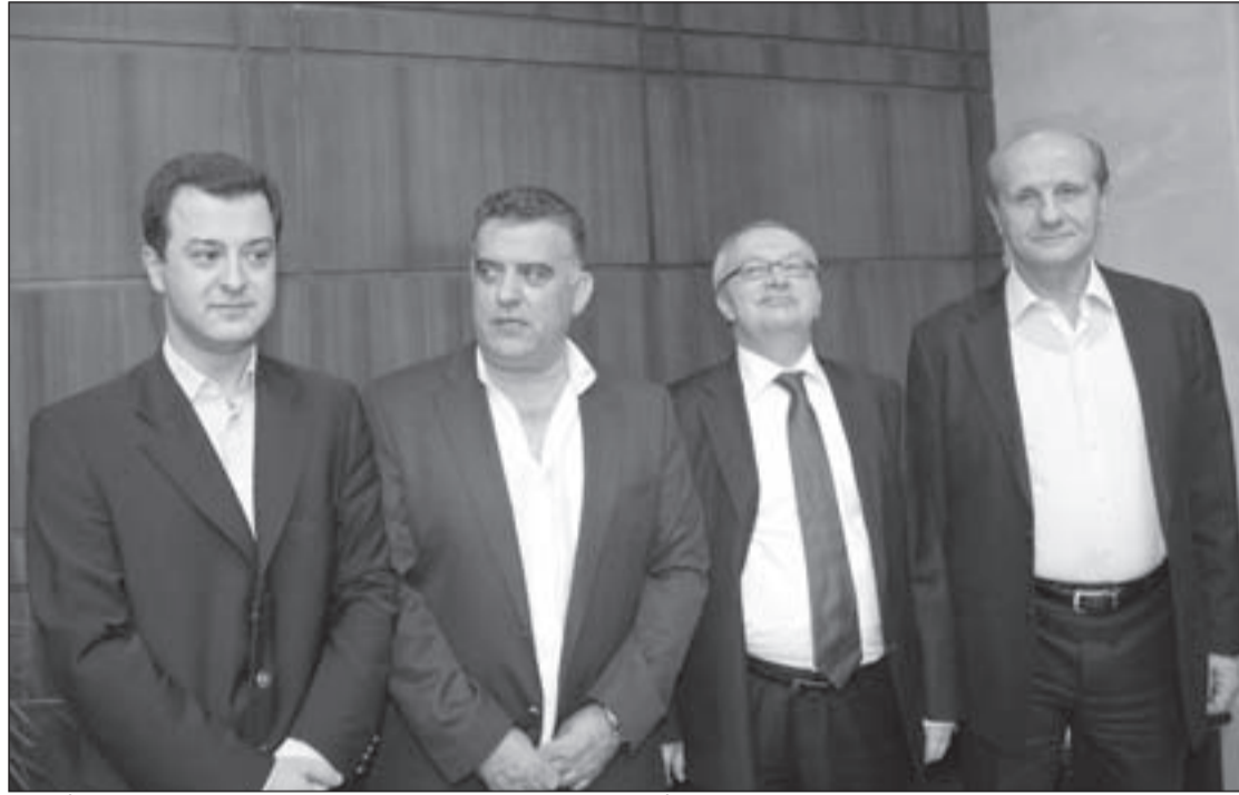
التركي تيكن طوفان في مبنى الأمن العام اللبناني بعد إطلاق سراحه

محرّجة حكومة رجب طيب أردوغان، وتعيش في ارتباك لا تعرف كيف تخرج منه، إذ ما تكاد تخرج من مطب، حتى يوقعها شر أعمالها في مطب أخطر وأكثر إحراجاً.