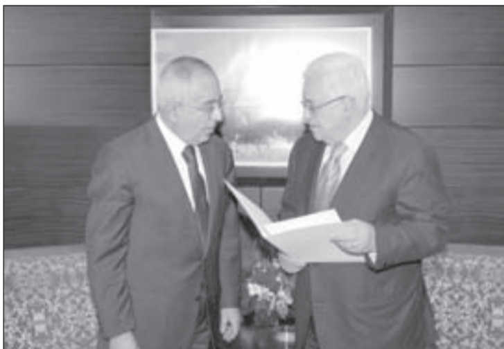
رئيس السلطة الفلسطينية محمود عباس ورئيس الحكومة سلام فياض

تحدثت عباس عن أن المعاشات لن تكون كاملة هذا الشهر، وتحدثت هنية عن الحصار من جديد، طالباً نجدة مصر بعقد اتفاقيات اقتصادية ومنطقة تجارة حرة، الأيام القادمة ستكون صعبة على الحكومتين الفلسطينيتين.