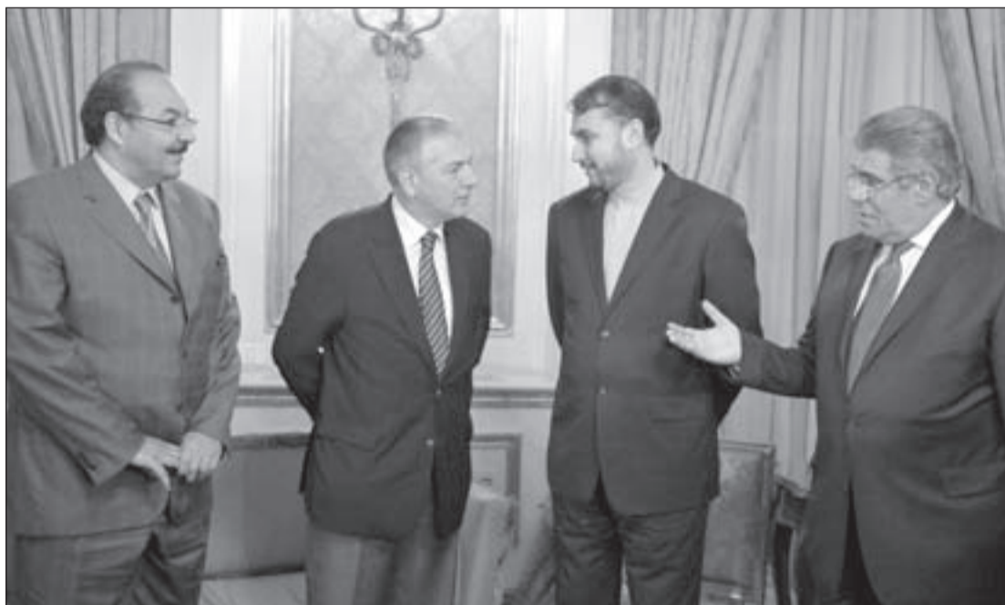
مندوبو اللجنة الرباعية حول سورية (المصري والإيراني والتركي والسعودي) قبل اجتماعهم في القاهرة

أمام المعارضة السورية المتنوعة، وهي أن أسياهم في الخليج وتركيا وواشنطن وباريس يقولون لهم شيئاً، وفي الاجتماعات المغلقة وفي اللجان يقولون أشياء أخرى، وكثير من الكلام قيل عن هذه المعارضات التي يمتلكها نهم مثير للمال والسلطة.. والدم أيضاً.