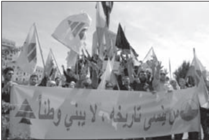
مظاهرة لأنصار حزب الكتائب اللبنانية

انتخابات 15 نيسان 1951، إلا أن مبادرة شاريت كما يقول الآن مينازع في كتاب «حرب لبنان»، بالرغم من طابعها الرمزي، لم تكن خالية من خلفية سياسية، لأن حدود الدولة العبرية مع الدول العربية، كانت خطوطاً لوقف إطلاق النار، بينما كانت الحدود مع لبنان هادئة وفق خط الهدنة، ولهذا أولاه الصهاينة اهتماماً خاصاً. وفي عام 1956، وقبيل أسابيع من حملة السويس، صرح رئيس وزراء العدو الصهيوني دايفيد بن غوريون لنظيره الفرنسي: «سنفكك لبنان، ونخضعه، وسيكون دولة يمكن أن توقع معها بعض المعاهدات» (وقد حققها أمين الجميل في