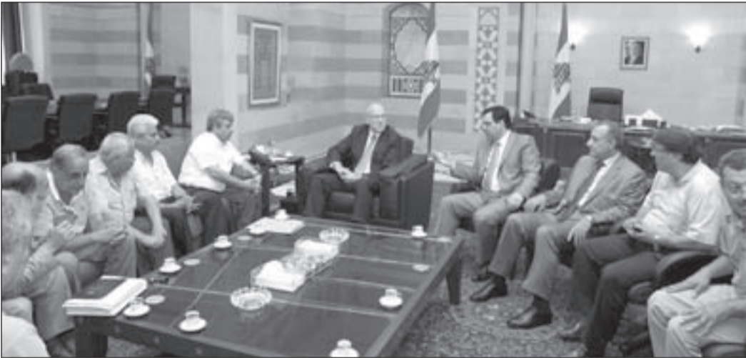
الرئيس نجيب ميقاتي مستقبلاً وفداً من هيئة التنسيق النقابية بحضور وزير التربية حسان دياب