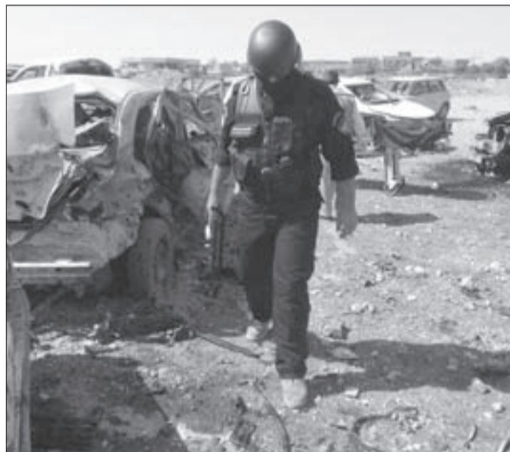
أحد رجال الأمن يعاين مكان الانفجار الذي وقع في كركوك

وعليه، كان لا بد وفق خطة الإدارة الأميركية الجديدة، من إشعال أوسع الفتق في العراق وجوارها، فبعد أن تمكنت المقاومة العراقية منذ نيسان 2003 من أن توقع في قوات الاحتلال الأميركي وحلفائه خسائر فادحة أنهكت إدارة المحافظين الجدد برئاسة جورج بوش الابن، وهو ما عملت إدارة أوباما على تلافيه، فنجحت في تحويل قسم من المقاومة العراقية إلى حليف للاميركيين من خلال الحشد والفتنة المذهبية، فأعيدت العلاقة مع «القاعدة»، إذ تؤكد معلومات المتابعين للتطورات العراقية، أن