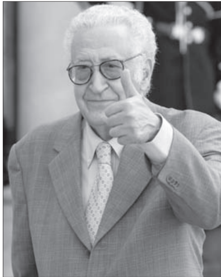
المبعوث الدولي لسورية الأخضر الإبراهيمي

إن مهمة الإبراهيمي رهينة نتائج المعارك الميدانية من جهة، وبانتظار الانتخابات الأميركية القادمة، فالميدان