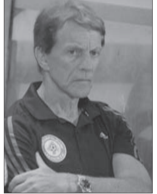
بوكير رد على المشككين بفوز تاريخي

وكان الاتحاد أجل المباراة النهائية إلى 17 أيلول المقبل، بدلاً من الثاني منه، بناء على تمنى المدير