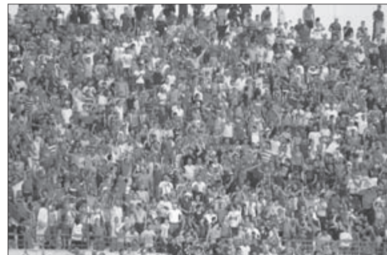
الجمهور اللبناني لعب دوراً كاملاً في مدرجات المدينة الرياضية

استعداد منتخب لبنان، بفوزه التاريخي على إيران 1 - 0، صورته المشرقة في الدور الثالث لتصفيات كأس العالم، وأكد أنه لن يكون جسر عبور لمنتخبات المجموعة الأولى في الدور الحاسم، بعد أن رفع رصيده إلى 4 نقاط، ليصبح على قدم المساواة مع إيران وقطر، اللتين تملكان الرصيد عينه،