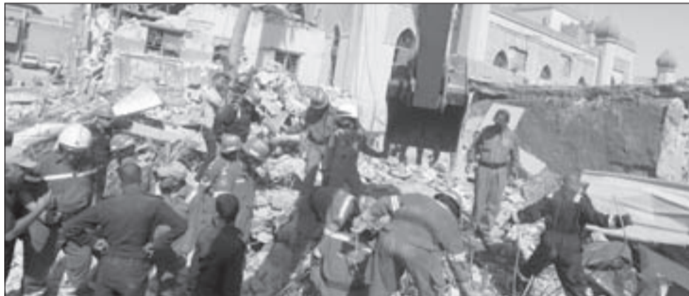
آثار التفجير الذي استهدف مقر ديوان الوقف الشيعي وسط بغداد