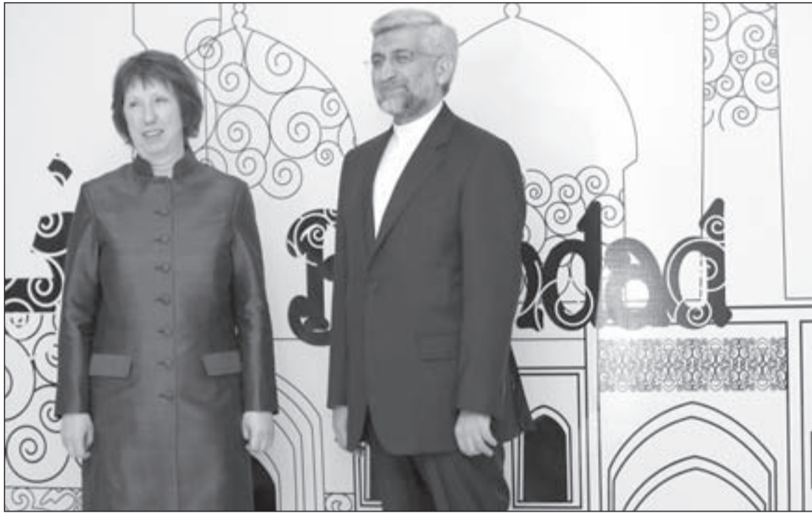
المفاوض الإيراني سعيد جليلي وكاثرين أشتون في بغداد

الأميركي، تم الاتفاق على أثرها بترحيل جميع الخلافات إلى الاجتماع المقبل في موسكو يومي 17 و18 حزيران، وتقول المصادر الدولية إن إيران مستعدة ضمناً للتفاوض حول حصر تخصيب اليورانيوم بنسبة 20٪ لكن مقابل أي ثمن؟