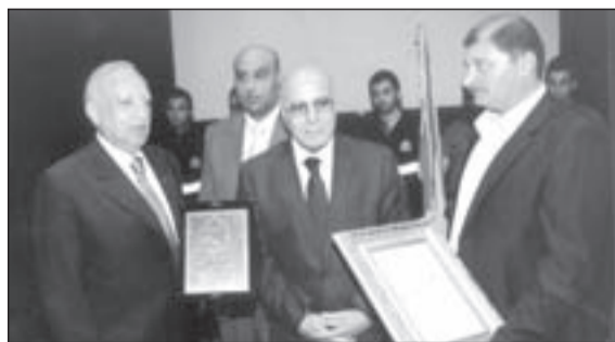
الوزير السابق خالد قباني ممثلاً للرئيس سعد الحريري

لرعاية شؤون اللاجئين الفلسطينيين قبل افتتاح مكاتب الأونروا. ثم استذكر نقيب الصحافة؛ محمد البعلبكي، أبرز محطات صداقته مع الراحل الحكيم في إطار الثوابت الوطنية التي حققت استقلال لبنان.