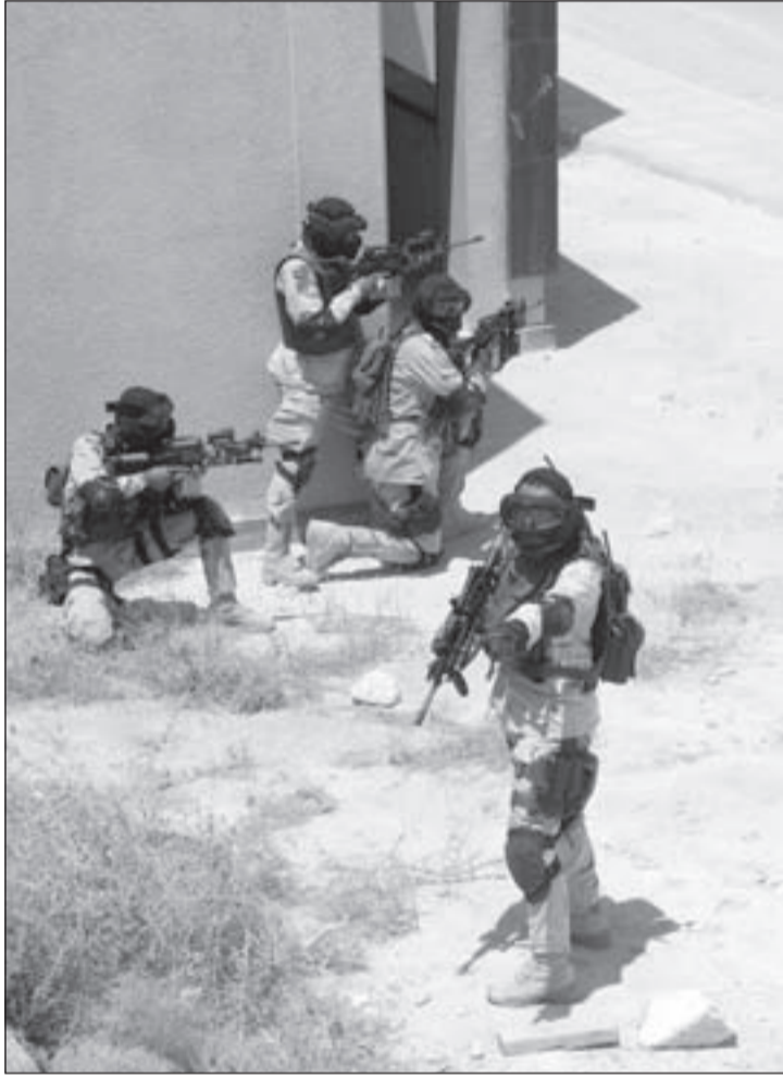
خلال مناورات «الأسد المتأهب» في الأردن

المجوقلة على بناء الجسور، وعبور الحواجز المائية، وجميع هذه المناورات ذات علاقة بالوضع الإقليمي عموماً وبالوضع الداخلي في سورية بشكل خاص.