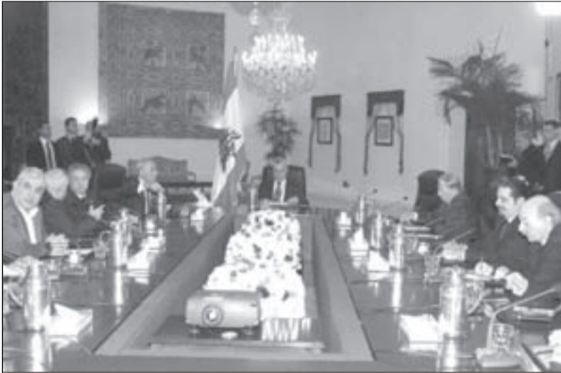
الرئيس ميشال سليمان مترئساً جلسة الحوار الخامسة التي عُقدت في بعبدا

بعدل ومساواة، بل إن هذا الرفض المتسرع للدعوة إلى إقامة الدولة الحقيقية لا يعبر عن تاريخ صراع اللبنانيين مع نظام 1943، فأين هذه الطبقة السياسية الحاكمة الآن من كمال جنبلاط ومعروف سعد وإبراهيم قبيلات وفاروق المقدم وعبد المجيد الرافعي، ومن انتفاضات اللبنانيين في مختلف مناطقهم رفضاً للظلم والتهميش؟ وهل تسقط المبادئ بمجرد أن يغير النظام قناعه؟ هذا النظام الذي لا يعنيه إذا بقي اللبنانيون في أرضهم أم تركوها إلى بلاد الغربة، ولا يعنيه إذا جاعوا أو سكنوا العراء، لأن دوره الوظيفي في مكان آخر.