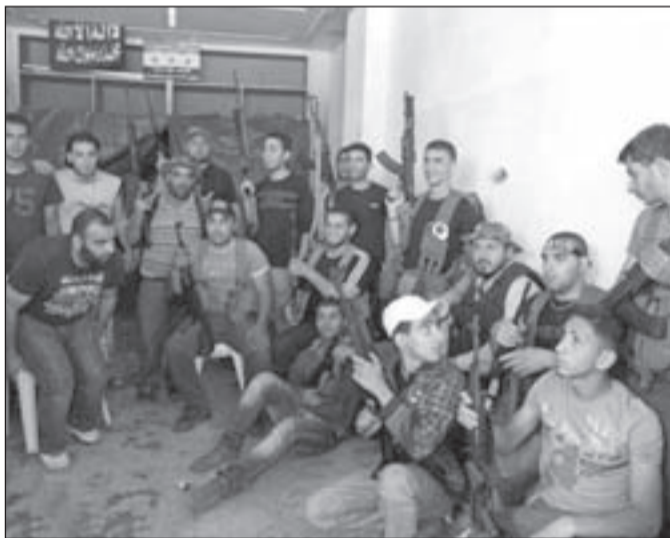
مسلحون في الشمال بانتظار «ساعة الصفر»

ولا يبتعد هذا الموقف كثيراً عن المساعي الأميركية المتجددة لتأهيل مطار القليعات، وتجهيزه ليكون بمنزلة الشريان الحيوي لـ«المساعدات الإنسانية» للشعب السوري. وتوضح المصادر أن مساعد وزيرة الخارجية الأميركية جيفري فيلتان، كما السفيرة الأميركية طرحة هذا الموضوع في أكثر من لقاء مع مسؤولين لبنانيين كبار خلال الفترة الماضية، باعتبار أنه «ينشط الحياة الاقتصادية في الشمال»، وهو ما كررته السفيرة الأميركية في حديثها مع مسؤول شمالي كبير، رد عليها بأن هذا الأمر «حساس جداً»، ولا يمكن مروره من دون تداعيات كبيرة.