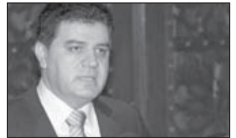
الوزير عدنان محمود

وقال محمود إن «الهدف من هذا القرار هو تغيير صورة وحقيقة ما يجري من أحداث في سورية عن الرأي العام الداخلي والخارجي، لصالح القنوات الإرهابية التي تمارس كل أنواع التزييف والفسركة وقلب الحقائق وإحلال الصورة