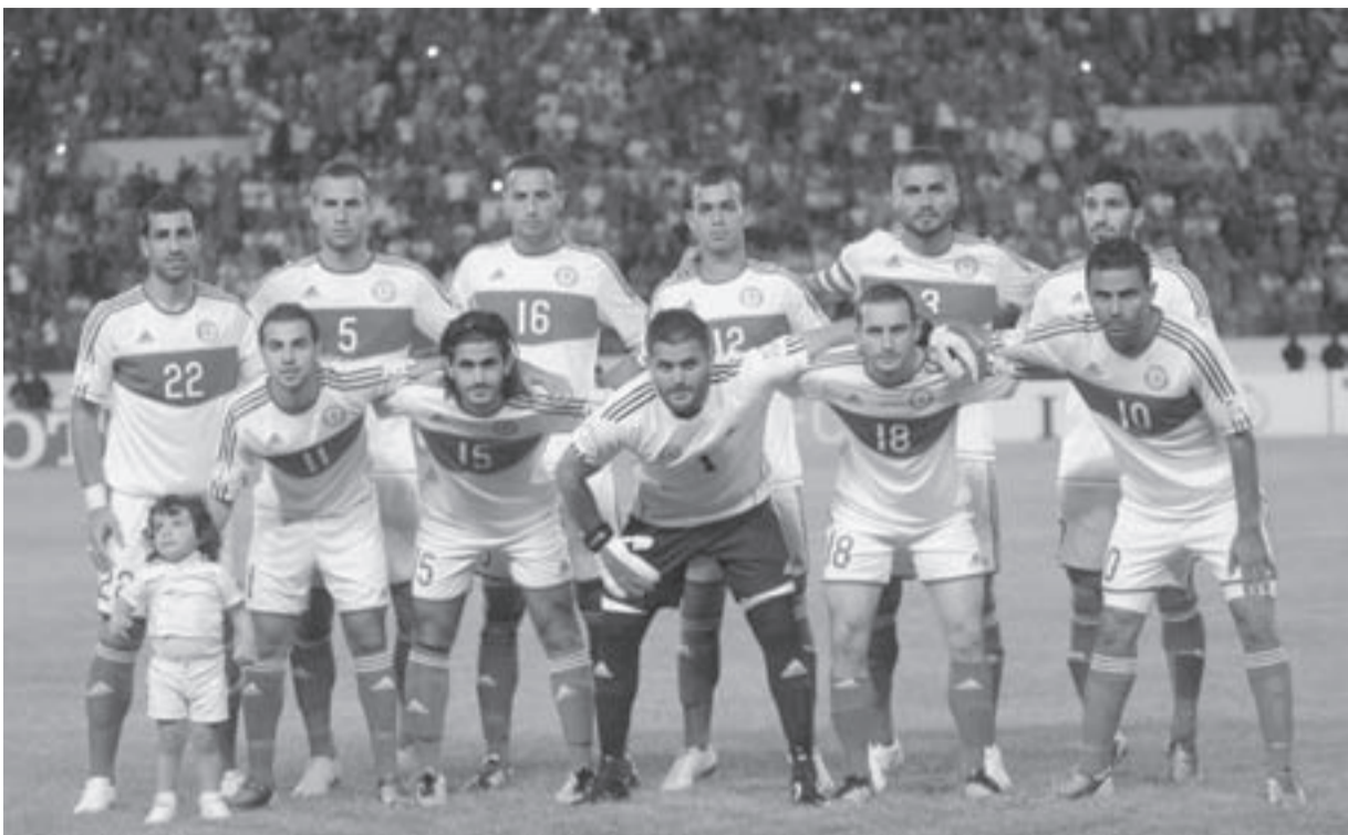
منتخب لبنان والمهمة الصعبة أمام أوزبكستان.

وعلى رغم خسارتها أمام إيران لم تكن أوزبكستان لكمة سهلة على الإطلاق، والدليل أن الأولى انتزعت الفوز في الوقت بدل الضائع بواسطة محمد رضا خلعتيري، وحرّم المنتخب الأوزبكي الذي لم يتأهل بعد إلى كأس العالم، من هدف صحيح في الدقيقة 75 من المباراة عندما اجتازت كرة أوديل احمدوف خط المرمى الإيراني، قبل أن يسجل الضيوف هدف الفوز في اللحظات الأخيرة، علماً أن أوزبكستان خاضت المباراة بغياب خمسة من أبرز لاعبيها بسبب الإيقاف، بينهم سيرفر جيباروف أفضل لاعب في آسيا مرتين.