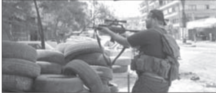
الدواب ليست للإحراق فقط.. بل لها استعمالات أخرى

رغم رفع الأفرقاء الطرابلسيين كافة الغطاء السياسي عن المسلحين في طرابلس، لا تزال المدينة تشهد تدهوراً في وضعها الأمني، جديده وأشدّه خطوراً هو الاعتداء على أبناء الطائفة العلوية، واستهداف مصالحهم خارج منطقة جبل محسن، في محاولة لإشعال فتنة مذهبية بين مكونات المجتمع الطرابلسي، بعد عجز الإدارة الخارجية للاقتتال في سورية ولبنان عن إثارة فتنة مماثلة في الجارة الأقرب، بالإضافة إلى فشل الإدارة المذكورة من إقامة منطقة عازلة على الأراضي، بعد تصدي الجيش السوري لأي محاولة من النوع، ما دفعها إلى توجيه أنظارها نحو لبنان الشمالي، مستغلة التنوع المذهبي فيه، لمحاولة إقحام مكوناته في اقتتال مذهبي، يؤدي حتماً إلى تقويض الاستقرار في بعض مناطقه، وبالتالي عزلها أمنياً عن سلطة الدولة، ووضعها تحت سلطة «التكفيريين»، لتأمين بيئة حاضنة للمجموعات المسلحة المتورطة في تقويض الاستقرار السوري، لاستهداف سورية انطلاقاً من لبنان، وما يؤكد ذلك هو مشاركة مجموعات تابعة للضباط السوري المنشق رياض الأسعد، والمسؤول في تنظيم «الإخوان»، أبو ياسر اللبائدي في الاشتباكات الأخيرة بين جبل محسن وباب التبانة، التي ما كانت لتتوقف لولا عرض أحد القادة الأمنيين أسماء بعض المتورطين فيها خلال اجتماع فاعليات طرابلس الذي عُقد في منزل الرئيس نجيب ميقاتي، الأمر الذي أخرج «المستقبل» ودفع المجتمعين إلى