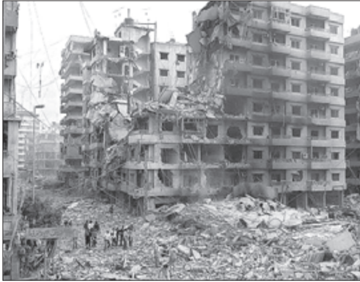
بيروت خلال الاجتياح الصهيوني في حزيران عام 1982

الأدنى من الأرض والحد الأعلى من السكان، وملخصها في إعلان الرئيس الفلسطيني محمود عباس أنه «يريد من الإسرائيليين أن يعطوه كيلومترات بالتمام، في إشارة إلى مساحة أراضي 1967 وليس بالضرورة في إطار حدودها».