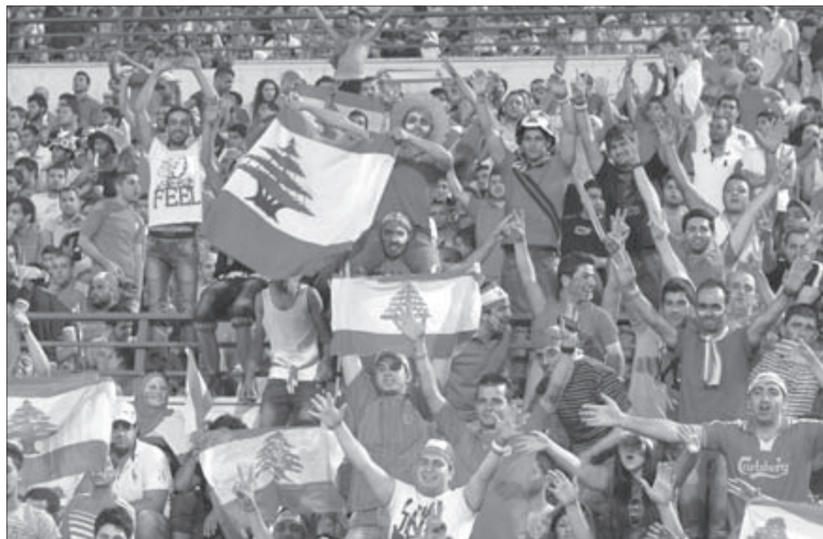
جمهور المنتخب اللاعب رقم 12

وانتقد بعضهم بوكير لغياب استراتيجية واضحة لديه، ولا سيما أن الكرة كانت بحوزة المنتخب القطري معظم فترات المباراة، فيما بدا الهجوم عاجزاً عن اختراق الوسائط «العنابية»، كما أن خط الوسط أخفق في صناعة الهجمات وتموين الخط الأمامي. ويرى المراقبون أن منتخب لبنان كان بعيداً عن مستواه في الدور الثالث حين لعب دور الحصان الأسود القادر بجرأته على قلب التوقعات بالاستناد إلى النتائج التي حققها عندما تغلب على الإمارات 3-1 وكوريا الجنوبية 2-1 في بيروت، وهزم الكويت 1-0، في الكويت.