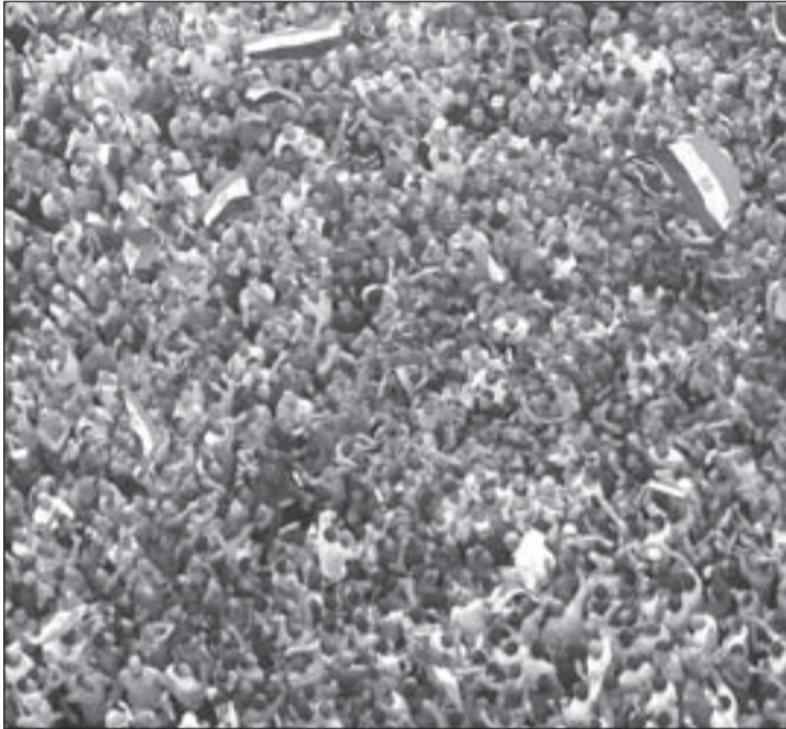
مصريون في ميدان التحرير رفضاً للأحكام القضائية المخففة بحق مبارك وابنيه وأعاونهم

لم تلد الثورة المصرية بعد، وإن وُلدت فليس من أباتها الشرعيين أو من الذين بدأوها وصاروا في كواليس النسيان. الثورة المصرية تتقاذفها في الداخل ثلاثة قوى: «الإسلاميون الجدد»، والمجلس العسكري، وبقايا النظام، وتتنافس قوى على نتائج الثورة ووراثة النظام الذي لم يسقط، فقد سقط مبارك كشخص، لكن منظومة النظام وأذرعه ما زالت تمسك بالخنق المصري.