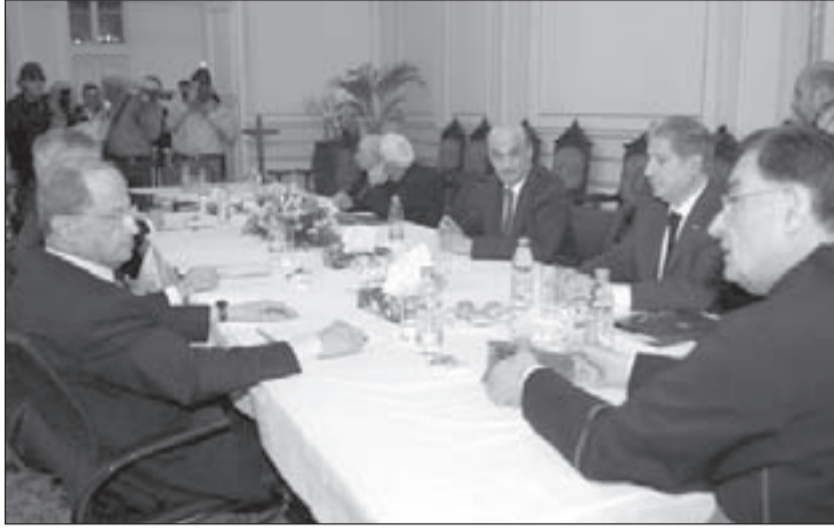
البطريرك بشارة الراعي جامعاً الزعماء المسيحيين في بركي

يعرفه هؤلاء، أن الإمارة الوهابية التي يُطمح إلى تأسيسها في الشمال، ستحاول الامتداد لربط بيروت وصيدا، ولن تقبل بكونتون مسيحي بشكل خاصرة رخوة للإمارة، أو يقطع الإمارة ويفقد بيروت وصيدا العمق الاستراتيجي المطلوب في المواجهة مع المقاومة في الجنوب والبقاع.