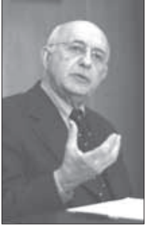
القاضي أنطونيو كاسيزي

ففساداً وهدرراً للأموال، وعلى ما يبدو أنه لم يعد يستطيع التغطية على الارتكابات التي يقوم بها المدعي العام الكندي دانيال بلمار. علماً أنه من المفترض بالقاضي كاسيزي أن يكون معتاداً على فساد المدعين العامين، فهو قد شهد في محكمتي يوغسلافيا ورواندا الكثير من الأخطاء والتعسف وتزوير الإفادات واتهام الأبرياء وأعمال الفساد التي قامت بها المدعية العامة كارلا ديل بونتي في تلك المحاكم، والتي تم الادعاء عليها بأنها قامت بترهيب الشهود ورشوتهم، كما قامت بتزوير الأدلة أو استخدام شهود وكانت المحكمة الخاصة بيوغسلافيا قد أنشأت في العام 2010 لجنة مستقلة لتقصي الحقائق من أجل التحقيق في الممارسات التي قامت بها ديل بونتي وفريقها في الادعاء العام خلال عملهم في محكمة يوغسلافيا، وذلك بعدما قام العديد من الشهود بالادعاء عليهم بجرم تزوير شهادات الشهود وترهيب أو ترغيب البعض الآخر منهم للإدلاء بالشهود وترهيب أو ترغيب البعض الآخر منهم للإدلاء بإفادات كاذبة تؤدي إلى اتهام أحد قادة الصرب «سيسيلاف» بارتكاب جرائم حرب في البوسنة.