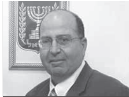
الوزير الصهيوني موشيه يعلون

يحتل التنسيق الأمني مكانة خاصة لدى السلطة، وفي كل المواقع التي تصدر عنها، يتبدى وكأنه مقدس لا يجوز الاقتراب منه، حتى تلويحاً بوقفه أو بخفضه، مع إدراك أهميته بالنسبة للاحتلال، ومع موجة الاعتداءات التي شنها المستوطنون الصهاينة مؤخراً، وطاولت بيوت الفلسطينيين وأشجارهم، ومساجدهم، لم ينبس فرسان التنسيق ببنت شفة. في حين أن هؤلاء ينسون أسنتهم خارج أفواههم، وهم يتحدثون عن الجهود التي يقومون بها، عندما يتحرك فلسطيني ليدافع