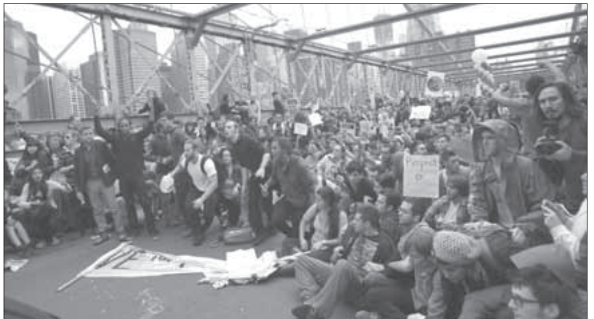
المواطنون الأميركيون يحتجون على ازدياد البطالة وارتفاع الأسعار