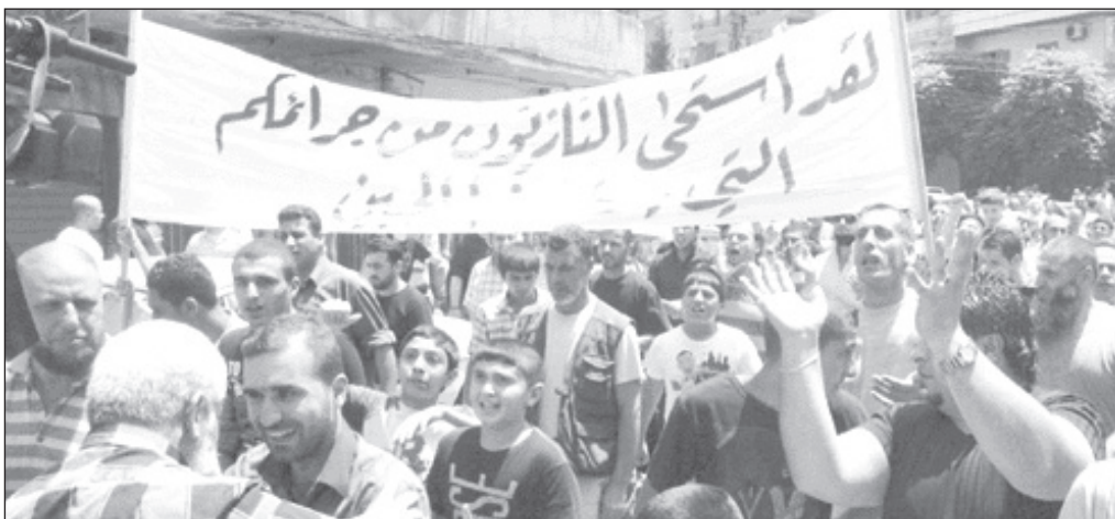
أنصار «المستقبل» يتظاهرون في طرابلس تأييداً لـ «الثورة السورية»

وفي هذا الصدد تؤكد مصادر مواكبة للتحركات المشبوهة في القرى الحدودية في الشمال، أن رقعة تحركات المهرين باتت شبه محصورة في منطقة أكروم، الموالية بغالبيتها لـ «المستقبل»، بعد فشل المهمة الموكلة إليه باستهداف سورية انطلاقاً من وادي خالد: كبرى المناطق العكارية، والتي أخرجها من الحياة السياسية، بعدما كانت ممثلة بنائبين في الندوة البرلمانية، وسعى إلى تحويلها إلى بؤرة للتآمر على الجار الأقرب لها، ضارباً بعرض الحائط كل الأعراف والمواثيق والتشابك الاجتماعي والاقتصادي بين لبنان وسورية، خصوصاً بين أبناء المناطق الحدودية. الهدهد والاستقرار عادا إلى وادي خالد، بفضل وعي أبنائها لخطورة المخطط الذي يستهدف سورية والمنطقة ككل، إضافة إلى دور الجيشين اللبناني والسوري في ضبط الأمن ومطاردة الخارجين على القانون. وبالنسبة إلى مخيم الرامة لـ «النازحين»، فقد بات في عهدة الأمم المتحدة، ويحوي بعض المطلوبين لدى السلطات القضائية السورية وعائلاتهم ليس إلا، بعد فشل المحاولات