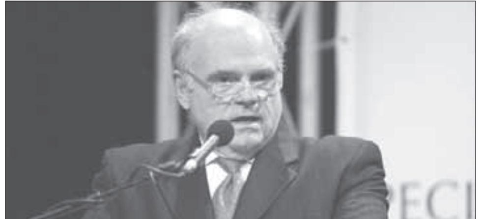
القاضي دانيال بلمار

اللبنانيين ما زالوا يعلنان رغبتهم والتزامهما بتمويلها من أموال الشعب اللبناني، في ظاهرة تدل على استهتار بالمال العام، والرغبة في كسب رضى الدول الكبرى على حساب المواطن اللبناني وأمواله وأمور دافعي الضرائب من اللبنانيين الذين - وكما يتضح من الخطط الاقتصادية العلاجية التي يتقدم بها وزير العمل اللبناني شربل نحاس - أن دافعي الضرائب الأكبر هم الفقراء ومتوسطو الدخل، بينما يتنعم الأغنياء بجنة ضريبية لبنانية تزيد الهوة بين الفقراء والأغنياء، في بلد لا يتأمن فيه الحد الأدنى من مقومات الأمن الاقتصادي والاجتماعي، لمواطن مطلوب منه اليوم تمويل مؤامرة دولية تهدف إلى قتله وتجويعه، بذريعة «العدالة».