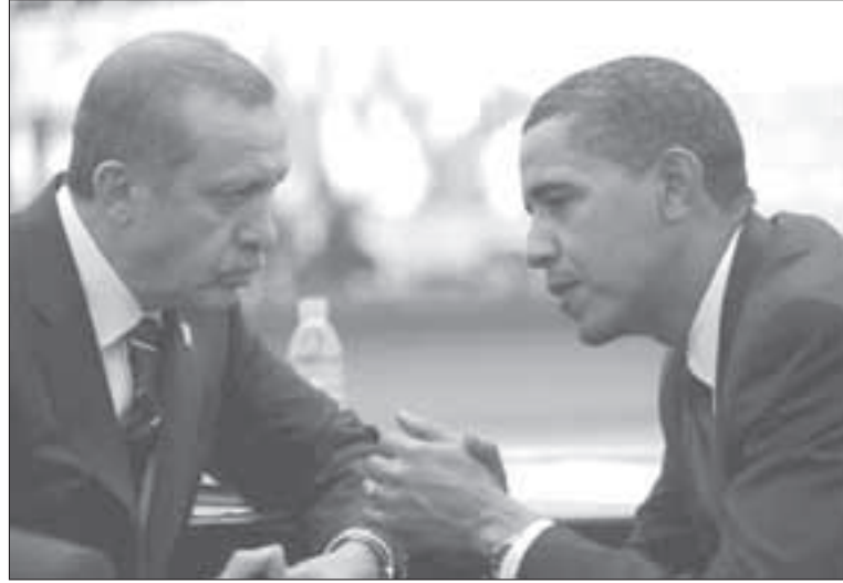
الرئيس الأميركي باراك أوباما والرئيس رجب طيب أردوغان

بأي حال، وحسب هذا الدبلوماسي، فإن تركيا - أردوغان حشرت نفسها في زاوية ضيقة جداً بعدائها لسورية؛ ممرها الإجماعي والوحيد نحو المنطقة، لافتاً إلى أنها بعد أن فشلت في إقامة «بنغازي سورية» على حدودها، هاهي تدخل لعبة المخابرات والدم، مؤكداً صحة ما أوردته صحيفة «الغارديان» البريطانية عن أن الاستخبارات التركية تقف وراء اغتيال المعارض السوري الكردي مشعل تمو، وحسب ما أكد مراسل صحيفة «غارديان» البريطانية في الموصل شمال العراق؛ جوناثان ستيل، فإن المخابرات التركية هي التي تقف خلف اغتيال مشعل تمو، والذي أضاف في تقرير وصف بالسري جداً والعاجل، أن الاغتيال جاء رداً على العملية النوعية التي قامت بها المخابرات السورية بالقبض على الضابط السوري الفارح حسين هرموش.