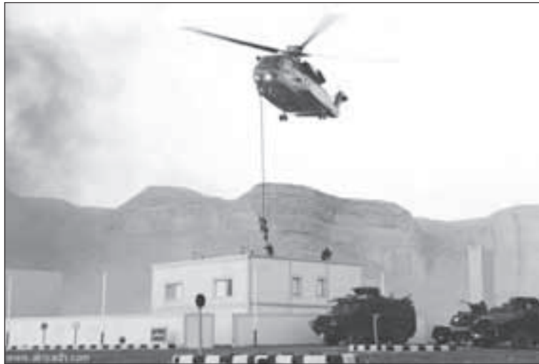
الألات العسكرية تستعد لقمع المحتجين في منطقة العوامية السعودية

ذلك، تردد عبارة أن المملكة آمنة في وسط محيط مضطرب، بحيث أصبحت عبارة غير مغرية للسمع، ولا تؤخذ على محمل الجد، لا بل أن هناك حركة احتجاجية غاضبة جداً لمن يتابع دقائق الوضع السعودي، والمطالب شأنها مطالب الشعوب الأخرى فيما يرتبط بتغيير أداء السلطة أو تغيير النظام السياسي. ويرى المعارضون أن الإعلان الملكي عن حقوق انتخابية للمرأة السعودية، ليست إلا