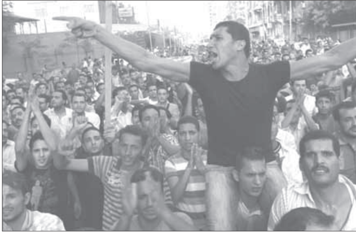
غضب عارم في الشارع المصري

المرحلة الانتقالية، وتأجيل الانتخابات؟ كيف السبيل إلى تداول السلطة عبر صناديق الاقتراع والأطر السلمية الديمقراطية من دون المزيد من المواجهات في الشارع؟ ثمة حقائق لا بد من الإشارة إليها، في ظل التطورات المصرية المتصاعدة، وهي أن المصريين، من كل الفئات والسيارات، سواء