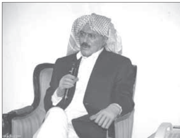
الرئيس اليمني علي عبد الله صالح

«ساحات» الثورة في اليمن مفتوحة على كل الاحتمالات والتطورات... والثابت الوحيد فيها هو أن المطلوب أميركيا وسعودياً أن لا تستقر هذه البلاد أبداً، والمرشحة لتقسيم جديد لن يقتصر هذه المرة على دولتين في الشمال والجنوب؟ مع حصة ترضية لحكام الرياض.