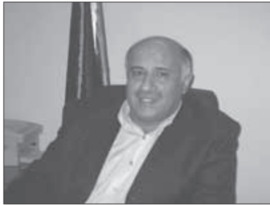
اللواء جبريل الرجوب

يستطع حتى الآن أن يجد له مكاناً في حركة الشعب الفلسطيني، وظل التجاوب معه شبه منعدم.